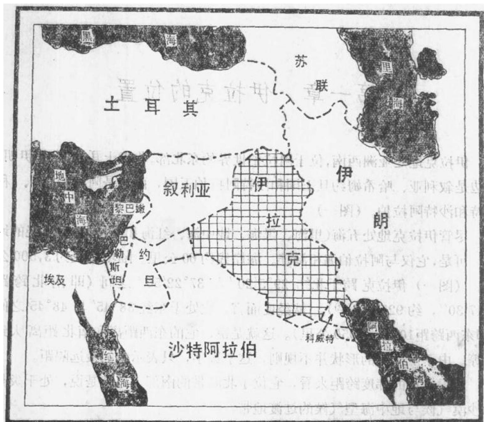
图一 伊拉克的地理位置

地区，人口稀少，甚至几乎荒无人烟，又无重要港口，除石油 ① 之外，也没有什么值得船只前来光顾的物产。