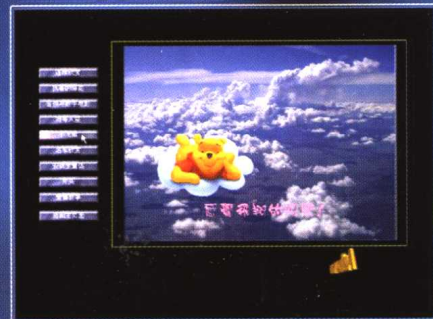
范例精展—按钮交互