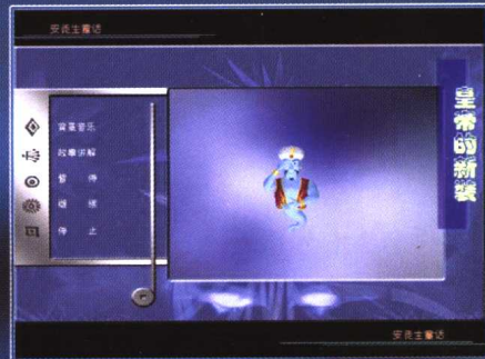
安徒生童话—显示标题