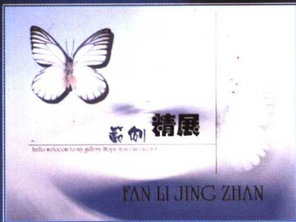
范例精展（详见第九章）