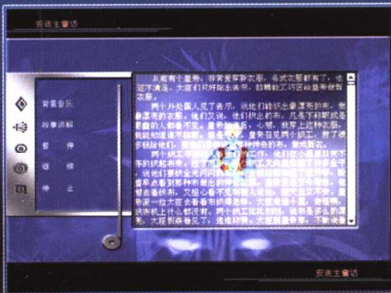
安徒生童话（详见第八章）