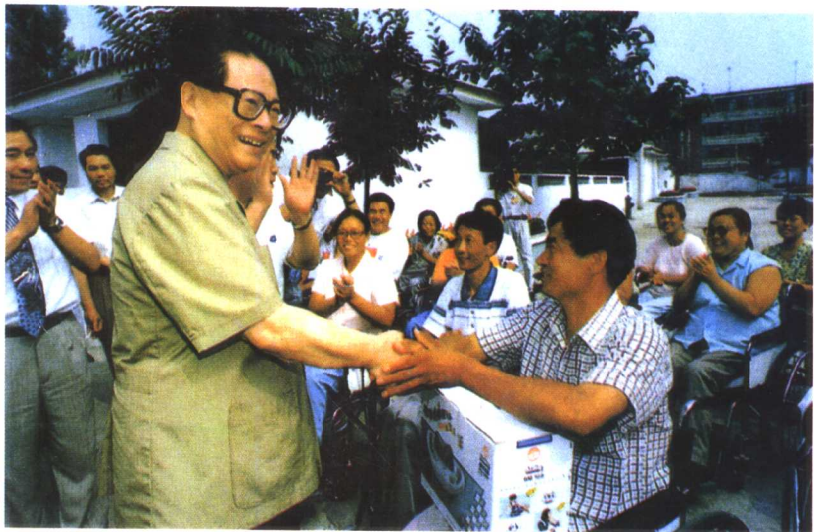
江泽民总书记看望被志愿者帮助过的唐山大地震中的伤残人士。