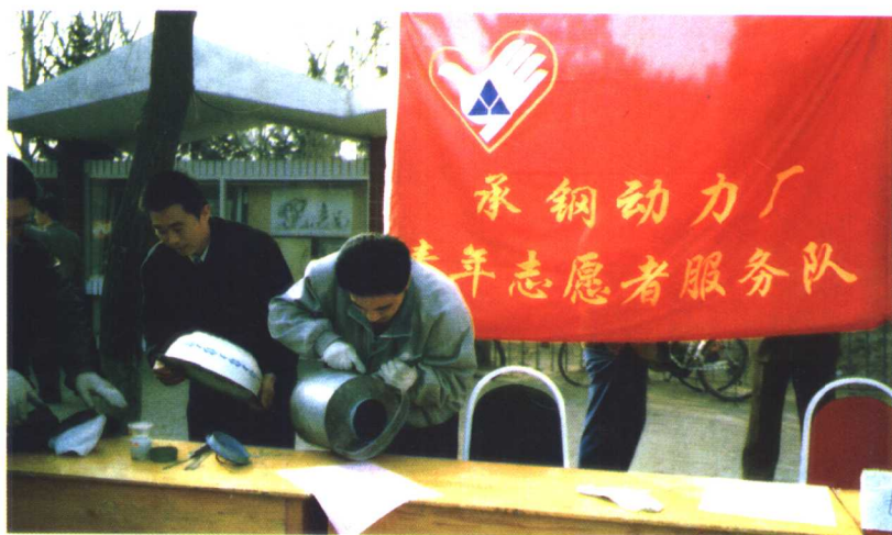
承钢的青年志愿者服务队在便民服务。