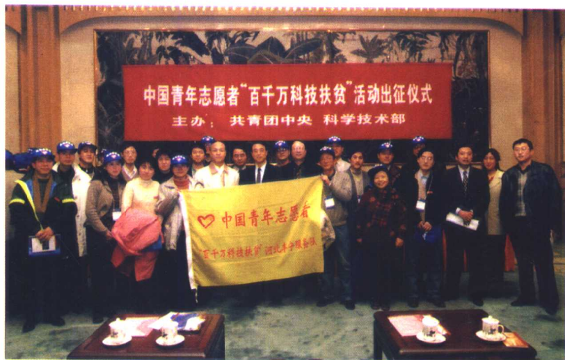
科技扶贫志愿者出征前合影。