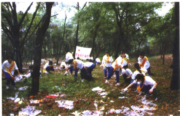
广州市的志愿者在捡白色垃圾。