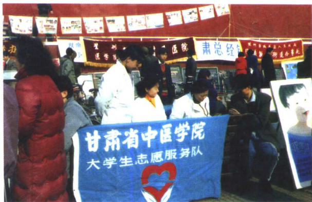
甘肃省中医学院的大学生志愿服务队在义诊。