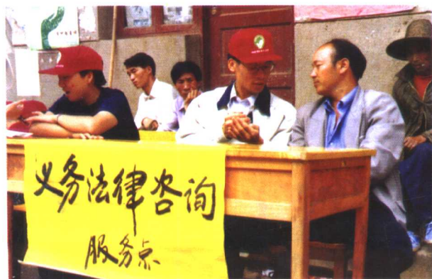
青年志愿者为群众提供义务法律咨询。