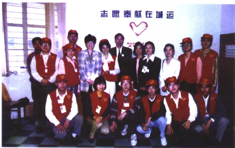
城运会上的志愿者。