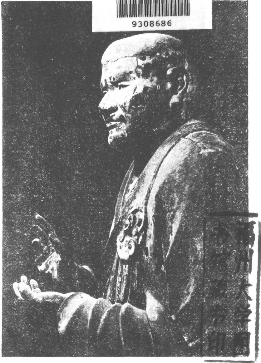
中寺福興本日存現