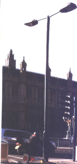
(上) 国会大厦门口的警察在疏导游客