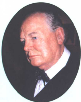
蜡像馆中的丘吉尔

英国人对丘吉尔有种矛盾的心态。尽管大多数人视这位前首相为拯救大英帝国的英雄，可也有人对他嗜酒如命、爱雪茄胜过老婆，以致在一些场合蛮横无理和虚伪的表演嗤之以鼻。人都有缺点和短处，丘吉尔也自难例外。但看一个人，似该从大处着眼。当黑云压城危在旦夕，短视的绥靖政策弥漫朝野，丘吉尔能力排众议，临危受命，并义无反顾率领英国民众向希特勒德国宣战这点看，他便是当之无愧的英雄。丘吉尔的确像个赌徒，可他更多的还是靠勇气、远见、智慧乃至判断力赢得了战争，也正因如此，英国才得以渡过难关，避开了黑暗年代。