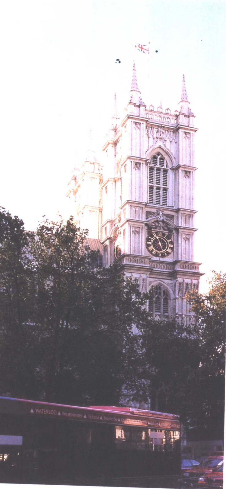
威斯敏斯特大教堂

堂那天像是举行什么纪念活动，但见白发苍苍的老人或穿礼服，或着二战时的军装，在老妻、儿女的搀扶下鱼贯而进，鱼贯而出。他们热烈地谈论着什么，兴奋得红光满面，挂满奖章的胸前金光闪闪。人们渐渐走来，走过丘吉尔的身边，穿过马路，汇入人流车海，谁也没停下来和他们当年的首相打个招呼。真是此一时也，彼一时也。丘吉尔会怎么想？对历史的健忘，好像任何国家都是一样的。