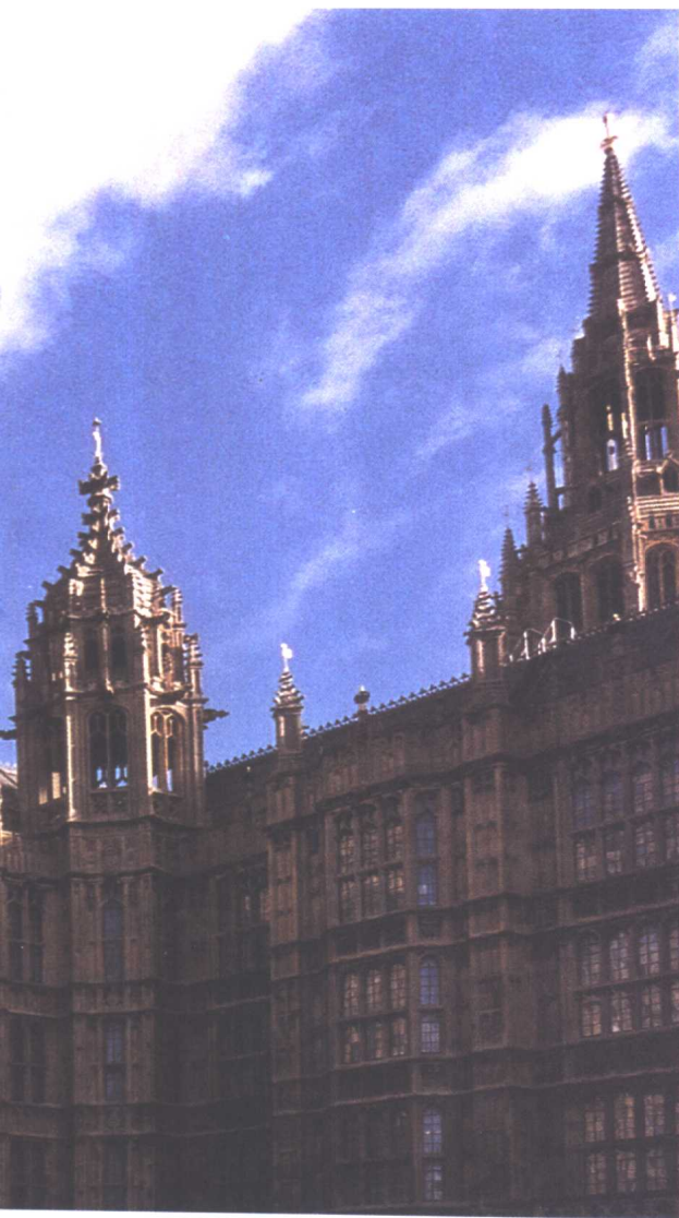
(左) 英国国会大厦 (右上) 国会大厦街上的骑警 (右下) 国会大厦门口的门卫