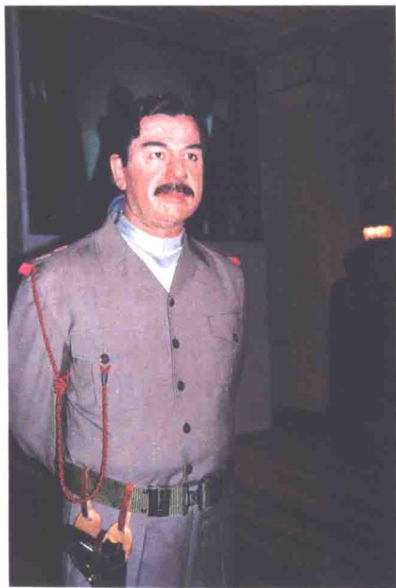
蜡像馆中的萨达姆