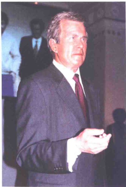
蜡像馆中的小布什

总统萨达姆。展厅的一边被布置成联合国的讲台，此刻，小布什和布莱尔好像正站在台上发表演讲，一身戎装的萨达姆则站在台下，满脸是冷漠和不屑的表情。这场面很富有戏剧效果，让参观者都不免驻足发笑。然而在各路英雄聚首的展厅中，丘吉尔却被冷落在一个角落里，默然旁观着人们的表演，嘴角上带着一丝嘲讽。此时的丘吉尔依然没戴礼帽，手里既没拿雪茄也没拄拐棍，只一袭黑色曳地的燕尾服，像正准备去参加晚宴，颇显出这个胖老头的绅士风度。其实，丘吉尔在生活里和私下的场合中是不乏幽默的，他有文学的天才，也有演员的天赋，即使在战争最危急的关头，也会不失时机地用他雄辩滔滔的演说和极富睿智的幽默把信念传递给人们。他微笑着伸出两个手指