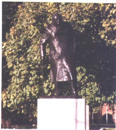
树阴中的丘吉尔塑像

特教堂里，葬着二十多个君主，以及从17世纪以来几乎所有英国的精英分子，本来这里也有丘吉尔的一席之地，可他的遗体后来被运回家乡了，所以在教堂门口的地面上只立了一块碑。丘吉尔干嘛要“逃离”这个英国人心向往之的荣誉圣殿而回他的老家呢？我猜不出。此刻，只见过往的行人似乎谁都没有注意丘吉尔塑像的存在，吝啬得不肯看上一眼。威斯敏斯特大教