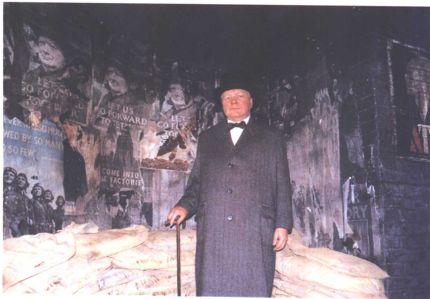
蜡像馆中的丘吉尔

也就是最近，或许是现实的某种需要吧，英国广播公司(BBC)忽然公布了一项评选结果，说英国的前首相丘吉尔力挫群雄、拔得头筹，在100位候选人里，被评为了英国历史上最伟大的人物。真是世事难料，倘若地下有知，丘吉尔该会怎样笑呢？