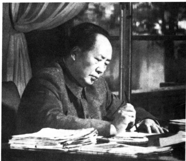
毛泽东同志在写作。