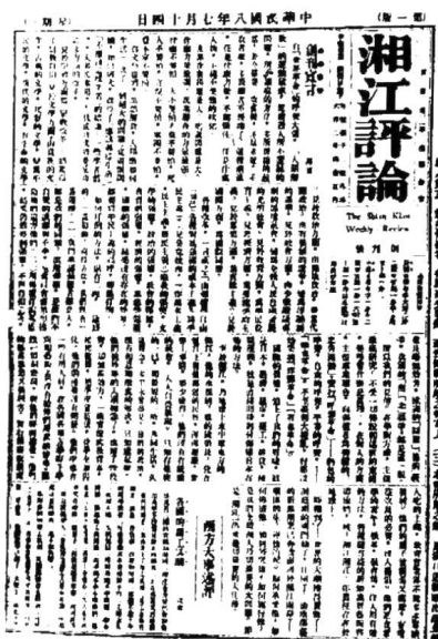
1919年7月14日，毛泽东同志主编的《湘江评论》创刊号，毛泽东同志是主要撰稿人。