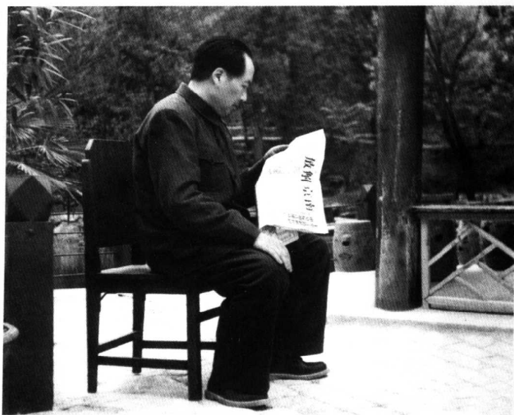
1949年4月23日，毛泽东同志在北京香山双清别墅喜读号外“南京解放”。