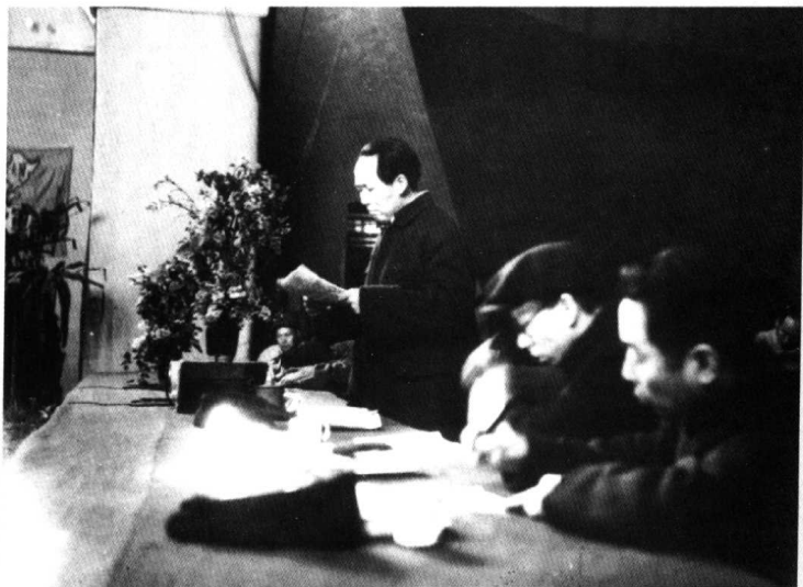
1945年毛泽东同志在延安中共七大上作报告。