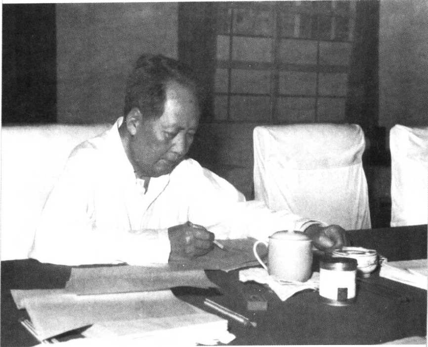
1960年毛泽东同志在广州校阅《毛泽东选集》第四卷。