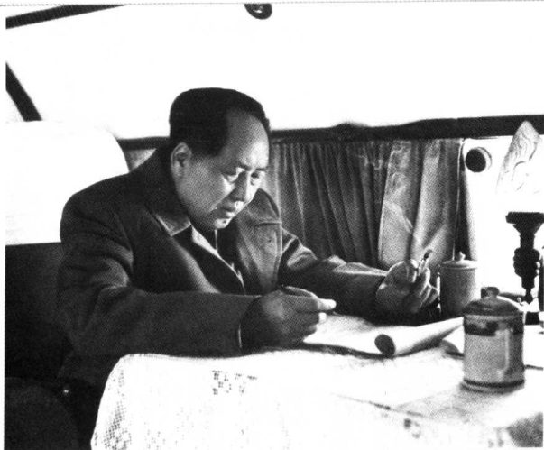
1957年春，毛泽东同志在视察途中的飞机上办公。