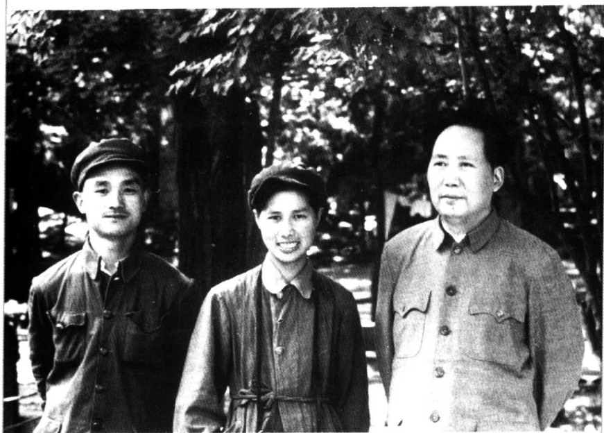
毛泽东同志与摄影师徐肖冰、侯波夫妇在一起。