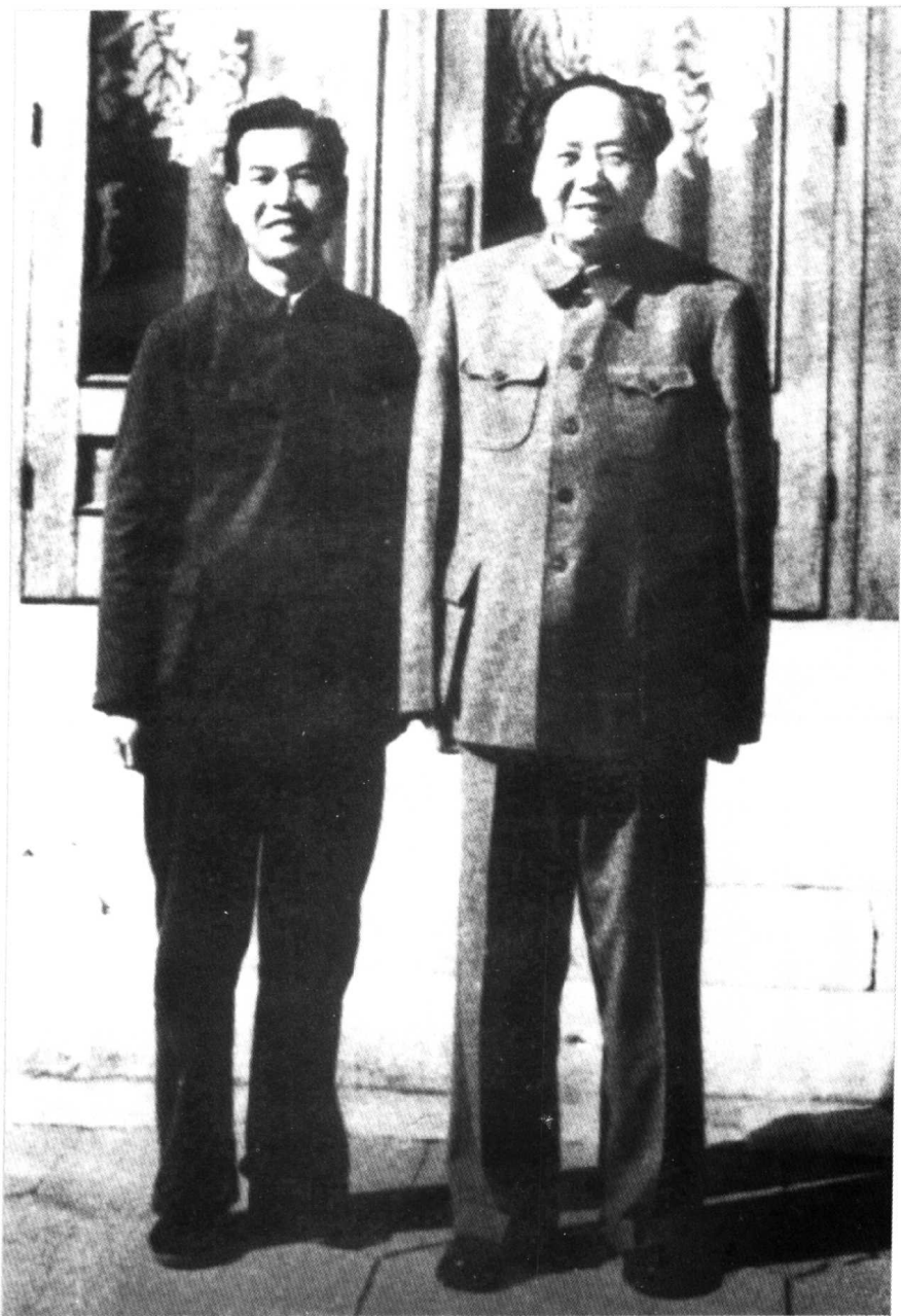
1962年毛泽东同志与机要秘书、《毛泽东的写作艺术》序作者高智同志在中南海丰泽园。