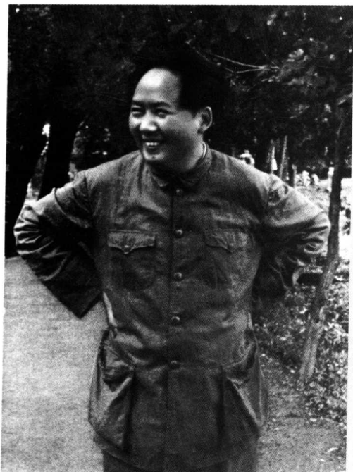
毛泽东同志