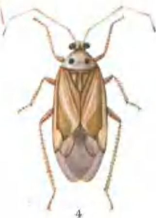
彩图 2—8 棉盲蝽象