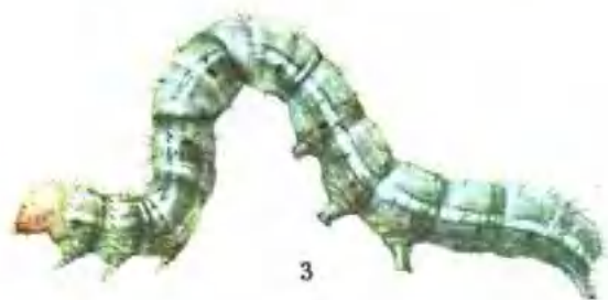
彩图 2—9 棉小造桥虫