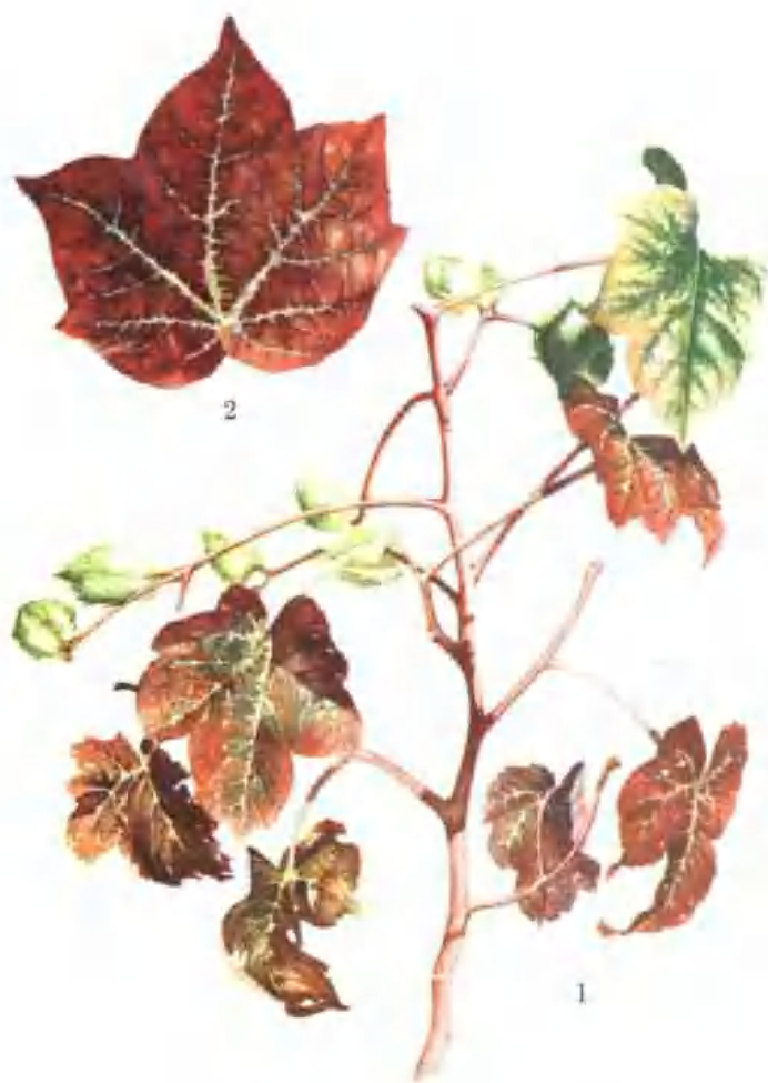
彩图 2—5 棉花红叶茎枯病