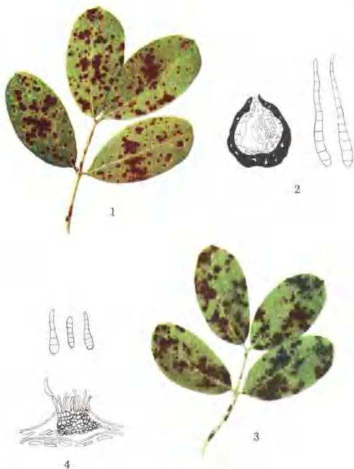
彩图 2—11 花生叶斑病