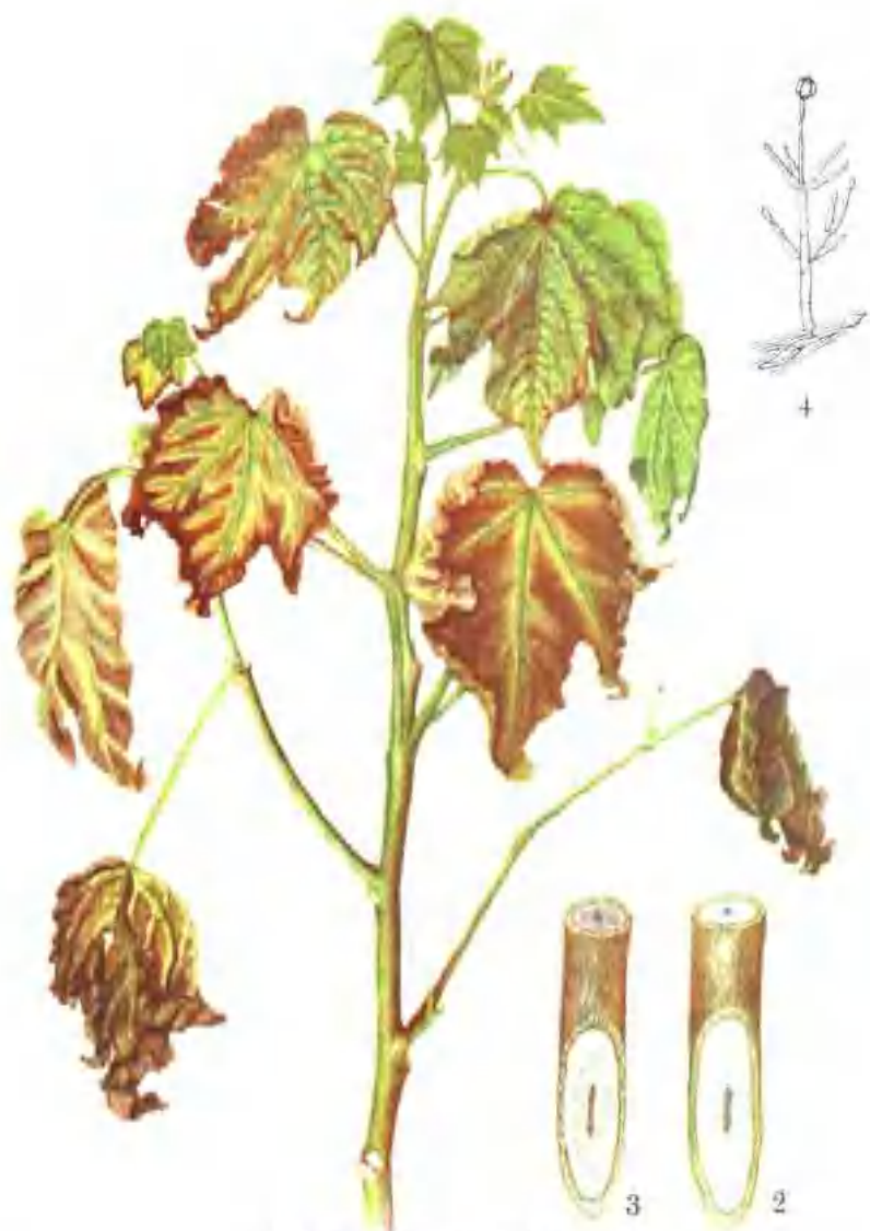
彩图 2—3 棉黄萎病

棉黄萎病 1. 病株 2. 健茎基部剖面 3. 病茎基部剖面(示导管呈黄褐色) 4. 分生孢子梗和分生孢子