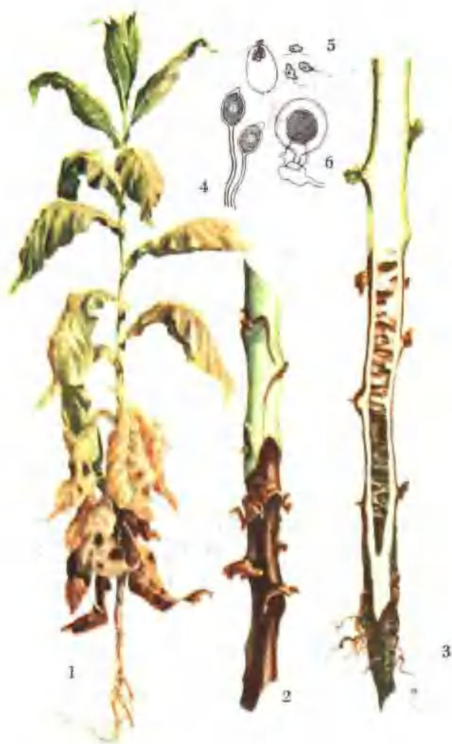
彩图 2—12 烟草黑胫病