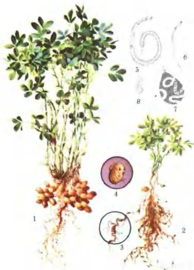
彩图 2—10 花生根结线虫病