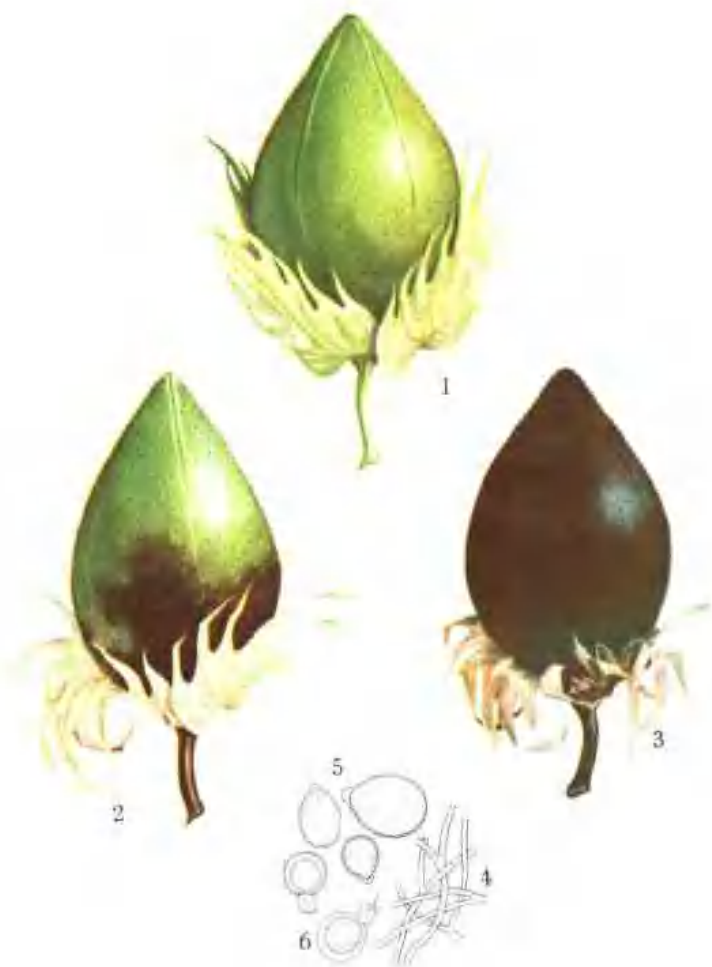
彩图 2—6 棉铃疫病