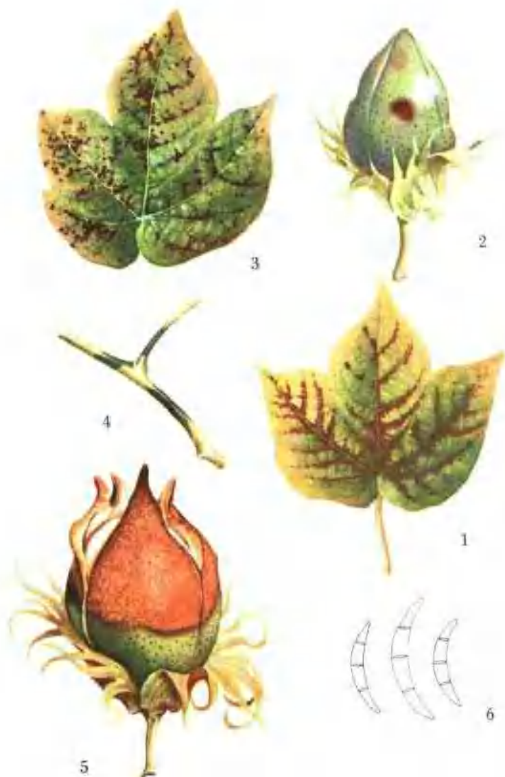
彩图 2—2 棉角斑病 棉红腐病