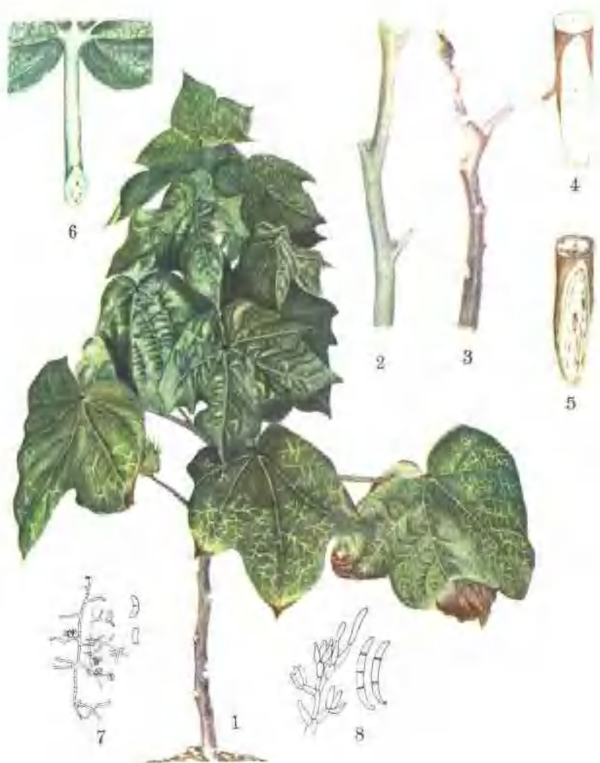
彩图 2—4 棉枯萎病

棉枯萎病 1. 病株 2. 健茎 3. 病茎(示节间缩短和叶片脱落成光杆) 4. 健茎基部剖面 5. 病茎基部剖面(示导管呈黑褐色) 6. 病叶叶柄基部剖面(示导管呈褐色) 7. 小型分生孢子梗和小型分生孢子 8. 大型分生孢子梗和大型分生孢子