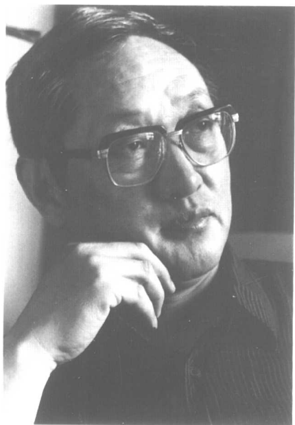
作者近影