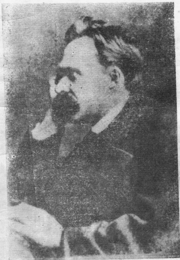
弗雷德里希·威尔海姆·尼采