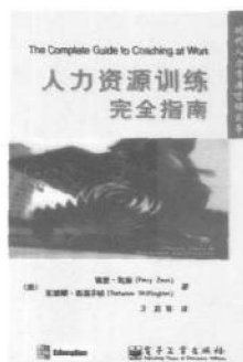
人力资源训练完全指南 ISBN: 7-5053-7623-3/F · 240 定价: 24.00 元