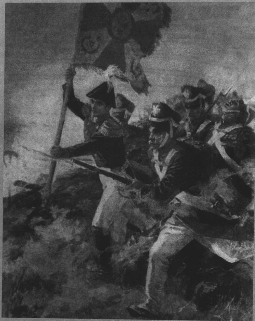
插图 《战争与和平》 插图