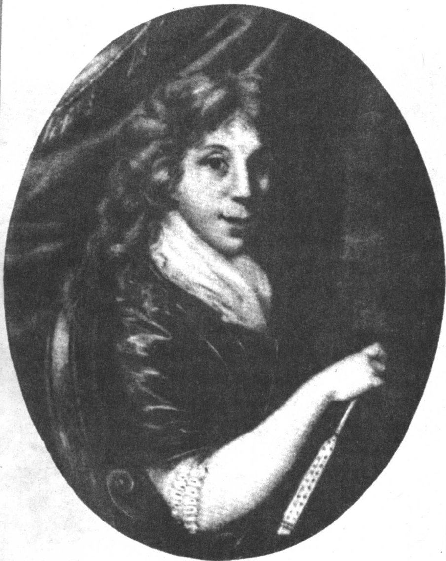
托尔斯泰娅，列夫·托尔斯泰的祖母