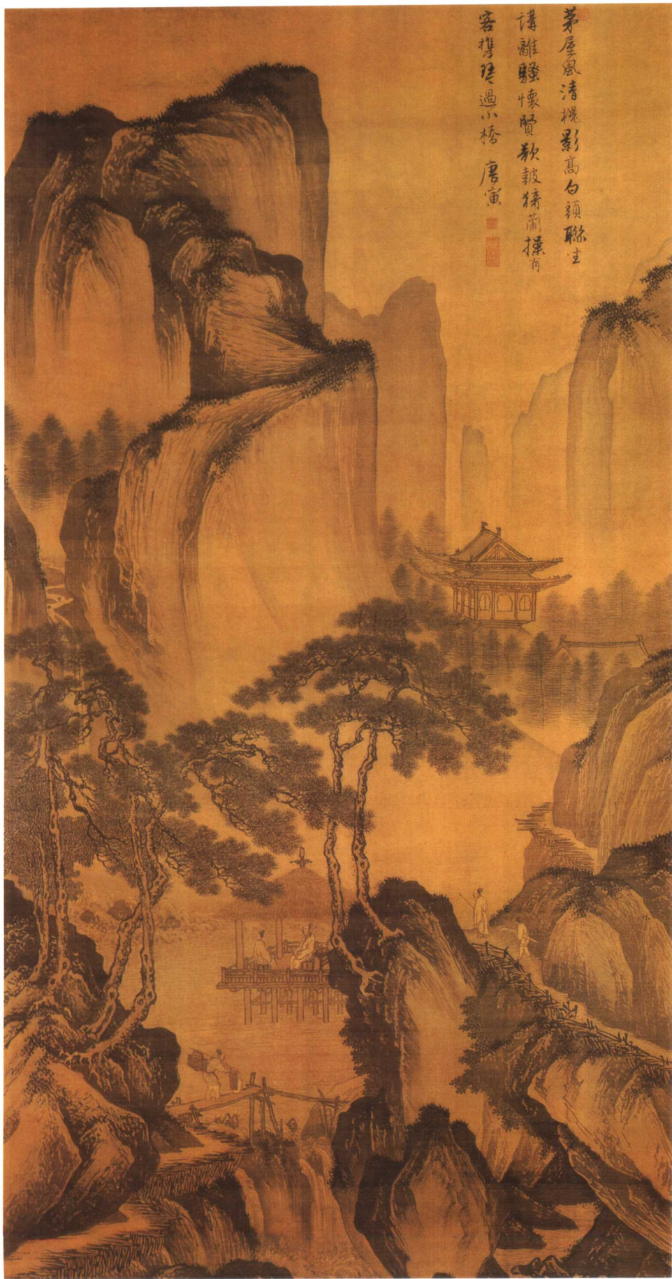
茅屋风清图 立轴 绢本设色 纵 122 厘米 横 65 厘米 上海博物馆藏