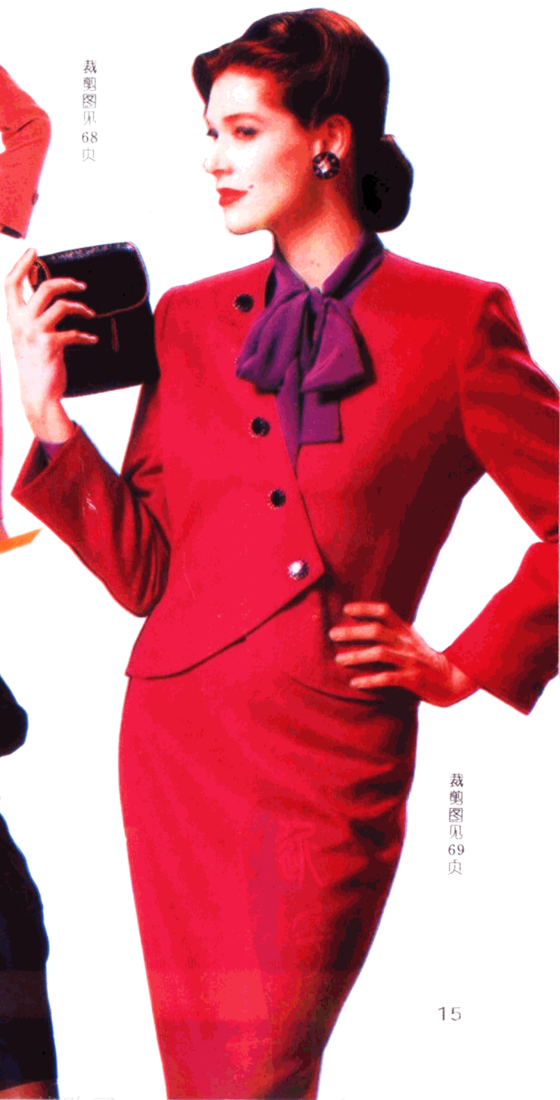
裁剪图见 69 页