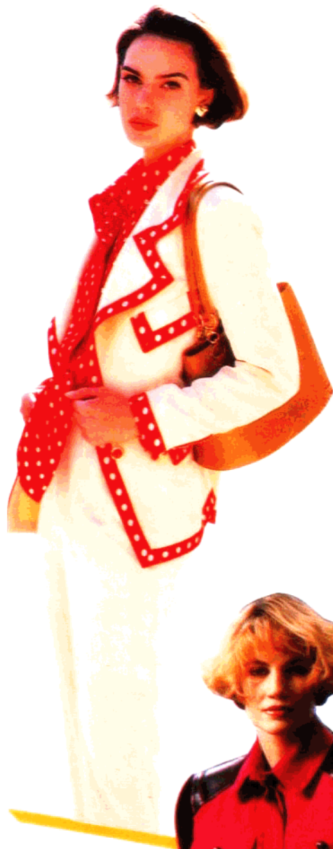
裁剪图见 53 页