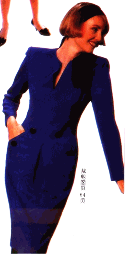
裁剪图见 64 页