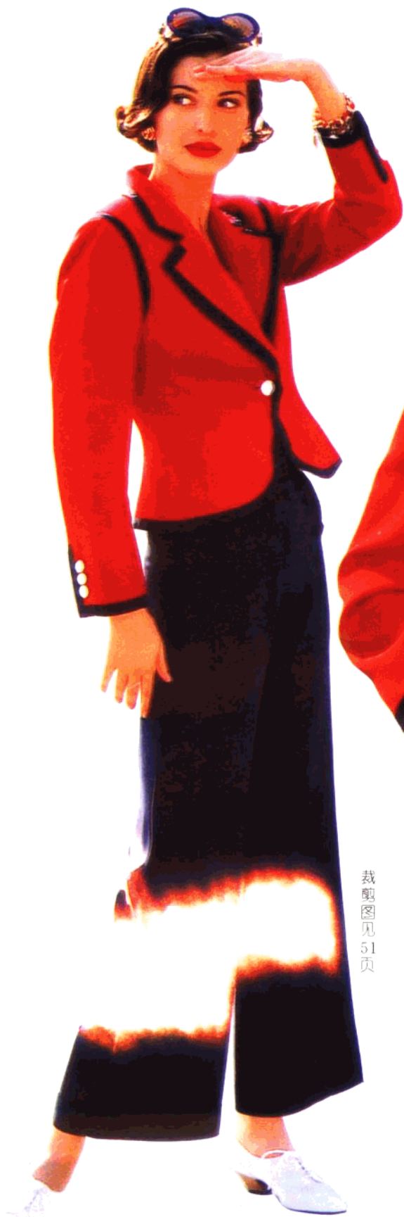
裁剪图见 51 页