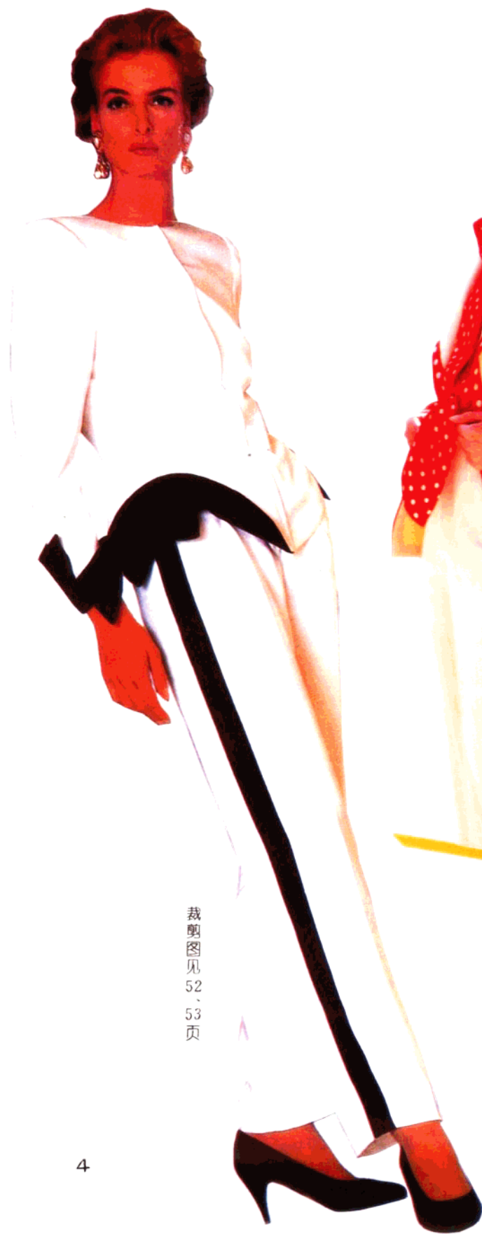
裁剪图见 52、53 页