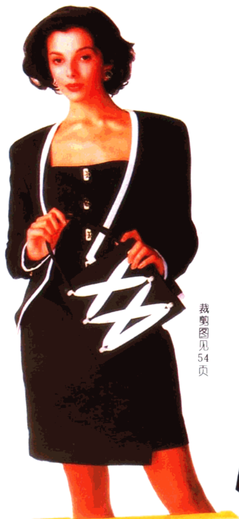
裁剪图见 54 页