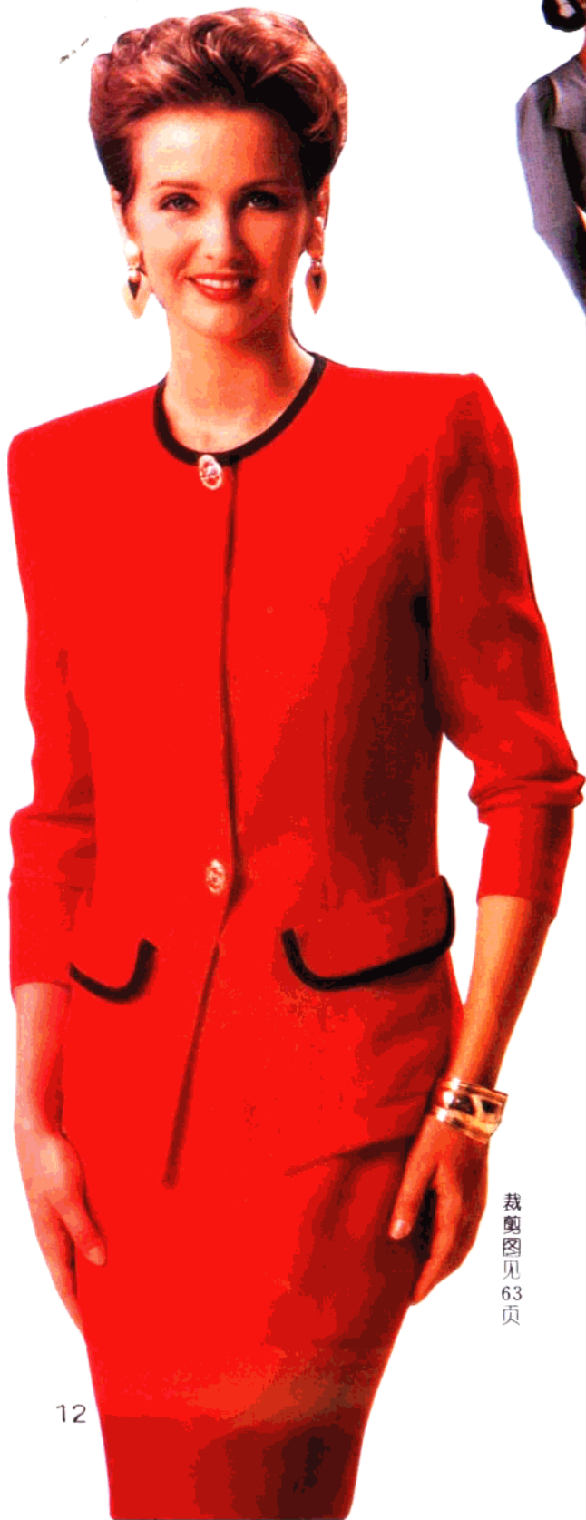
裁剪图见 63 页