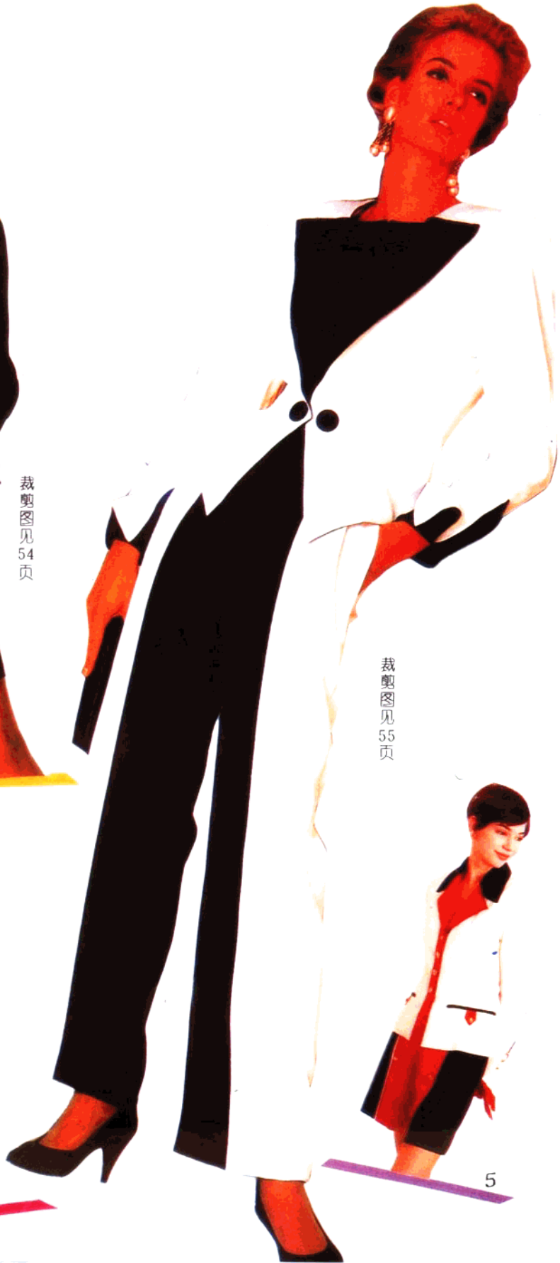
裁剪图见 55 页