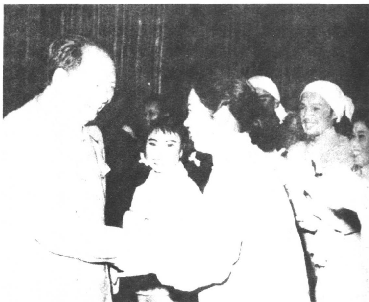
毛泽东观看豫剧现代戏《朝阳沟》时和豫剧表演艺术家常香玉握手