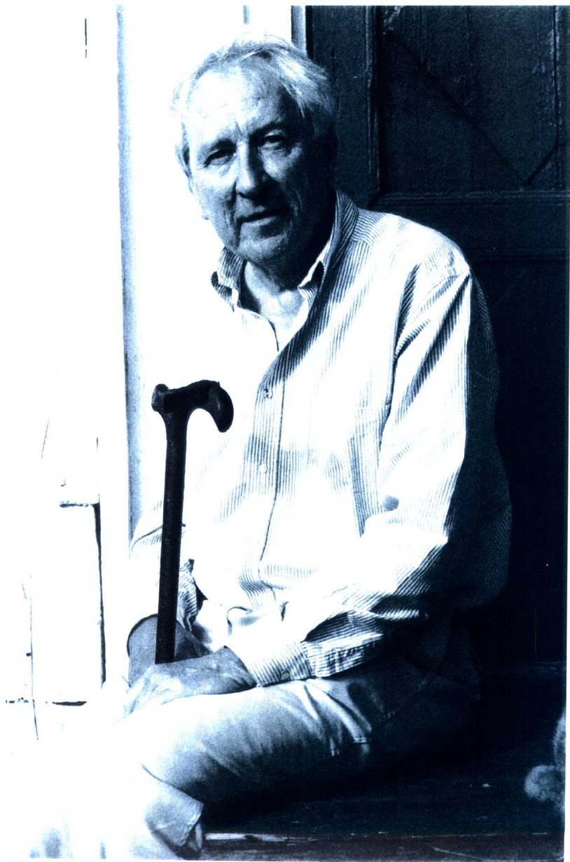
托马斯·特朗斯特罗姆像