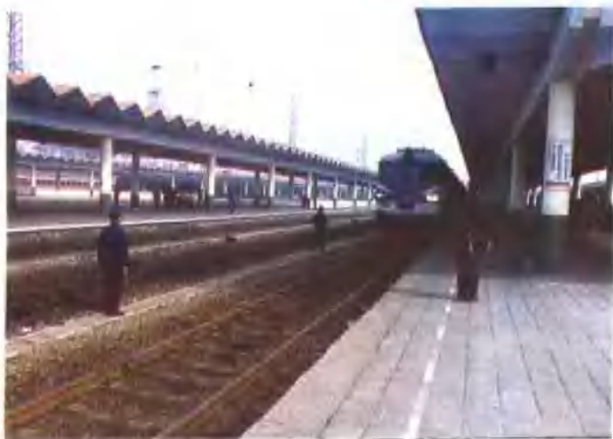
坚持作业标准化的客列检 职工在接送列车