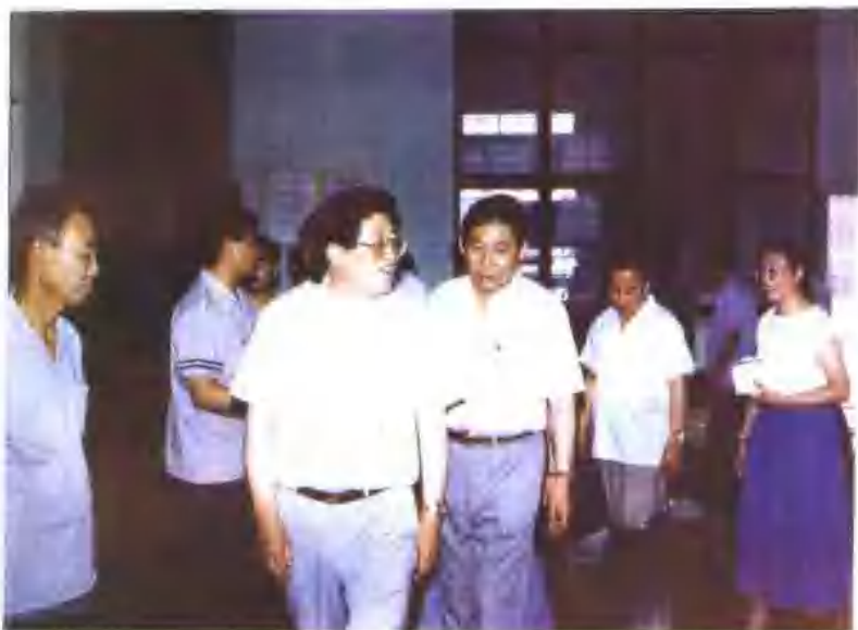
1993年5月21日铁道部长韩抒滨来段视察工作（左起段党委书记狄青林，韩抒滨，段长孟祥云）。