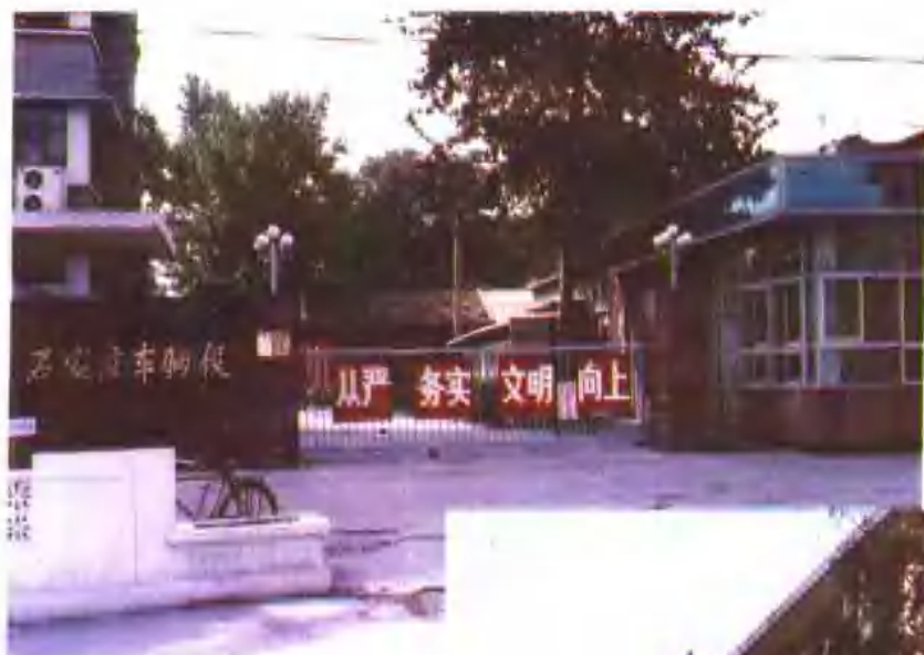
石家庄车辆段 大门全貌