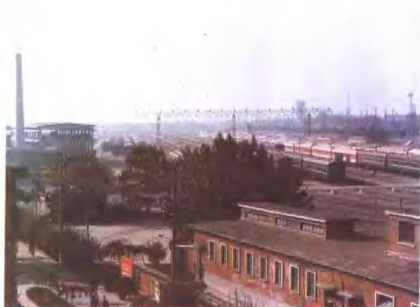
客车技术整备 所停车场全貌