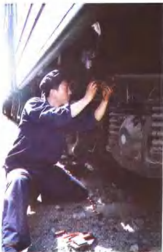
技术练兵与技术比武 (上, 下图)