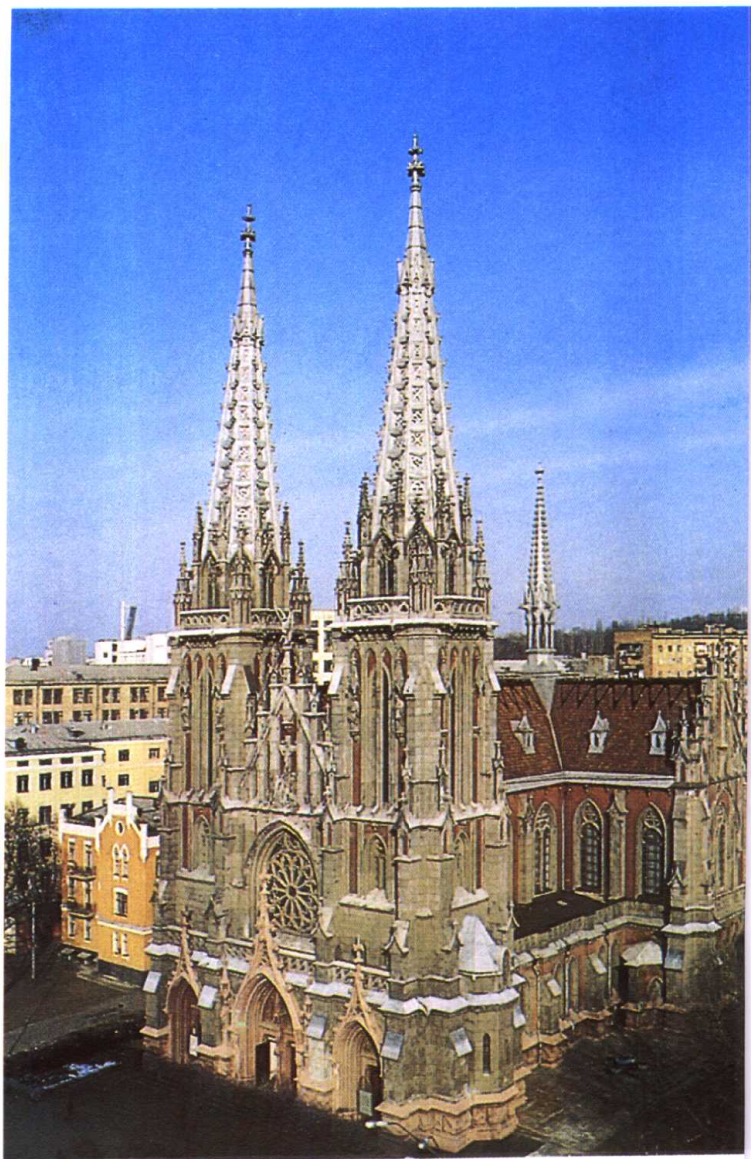
基辅市罗马天主教堂