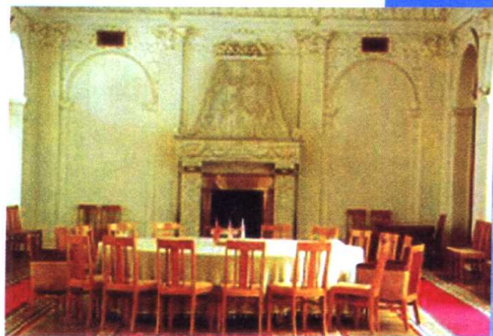
1945年“三巨头”雅尔塔会议的谈判桌