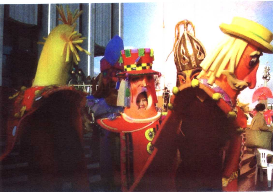
乌克兰人民欢庆谢肉节