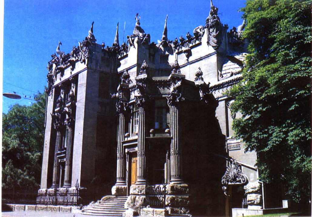
格罗捷兹斯基建筑物