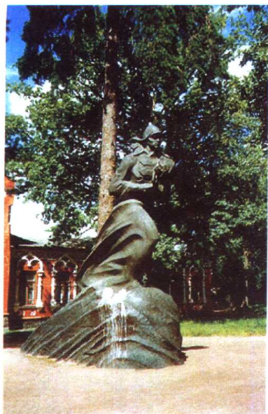
基辅市波亚尔小镇的 保尔·柯察金雕像