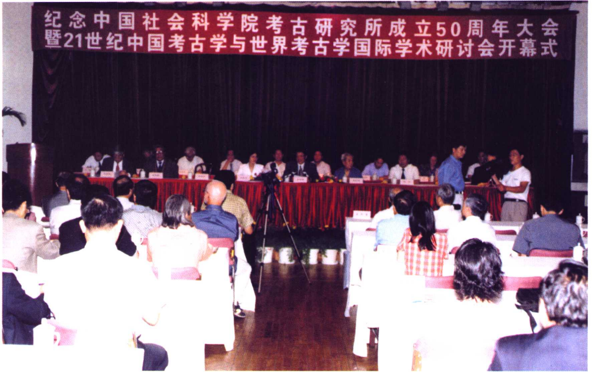
纪念中国社会科学院考古研究所成立50周年大会暨21世纪中国考古学与世界考古学国际学术研讨会开幕式现场