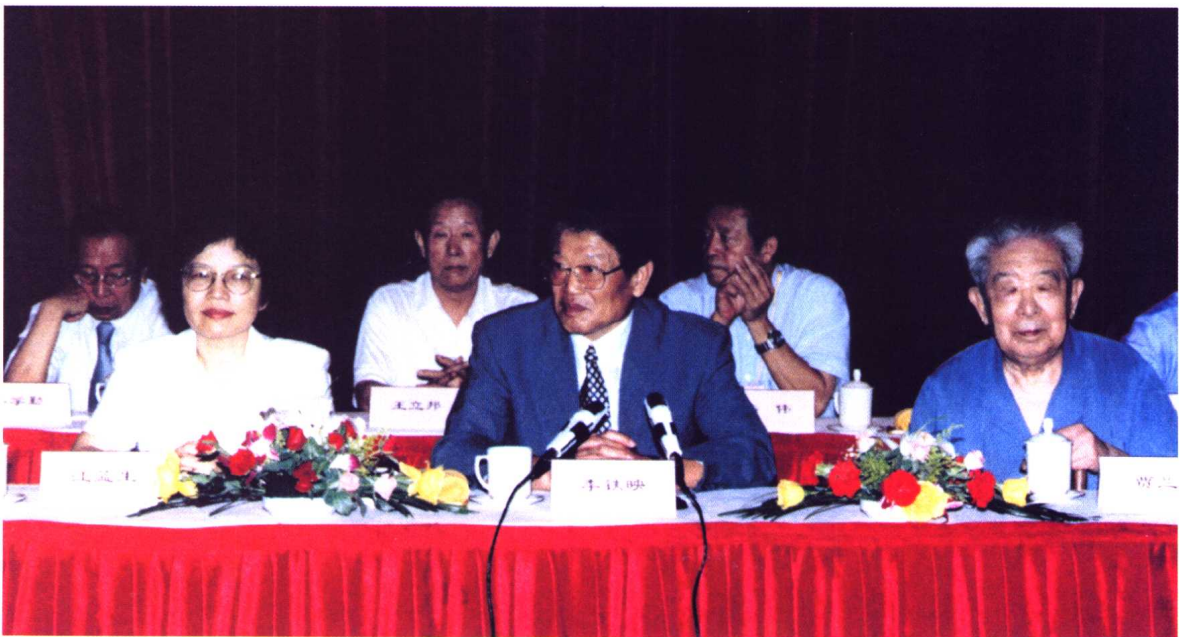
中国社会科学院院领导、著名学者在主席台上（前排从左至右为江蓝生、李铁映、贾兰坡）