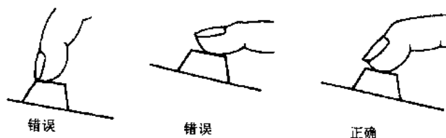
图 1-1 手指击键指位示意图

(2) 击键要领 手指自然弯曲轻放在“ASDF”和“JKL;”八个基准键上；击键动作要敏捷、果断、迅速；击键用力部位主要靠指关节，而不是用腕力，以指尖(指甲必须修平)垂直向键盘使用冲力，要在瞬间发力，并立即弹起，迅速回到基准键上。当某一手指击键时，其整个手都应跟着移动，以保证击键的手指能自由灵活，并及时击准下一键。在连续击键的操作过程中，如果需要以空格分隔，就应以大拇指击空格键。当右手正在工作时，就用左手的大拇指击空格键；当左手正在工作时，就用右手的大拇指击空格键。这样可以保证击键动作的连贯性和输入速度。如图 1-1 所示。