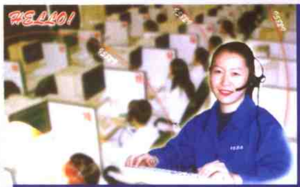
先进的客户服务系统