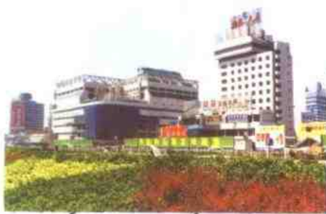
火车站货场和柏林大厦