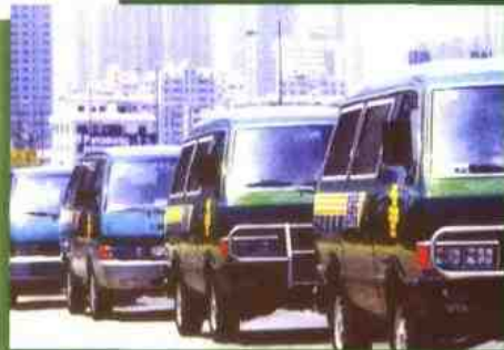
穿梭于城市的EMS车队