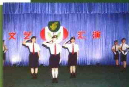
文艺汇演展示邮政职工风采