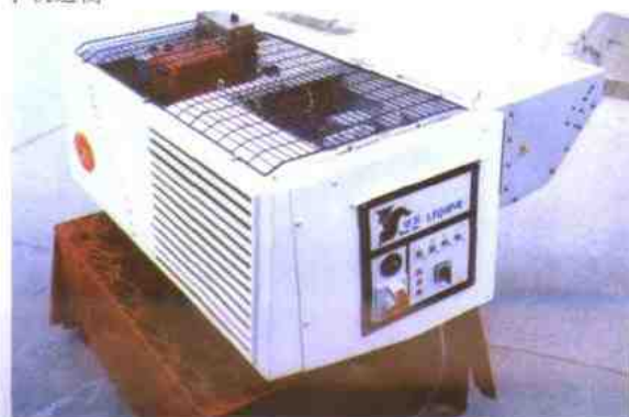
国铁分厂生产的公路运输“银狐”制冷机组