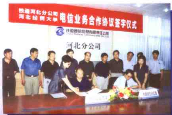
铁道石家庄分公司与河北经贸大学签定电信接入协议。