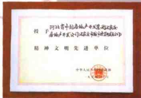
建设部精神文明先进单位