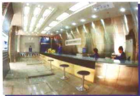
环境优美设备先进的营业大厅