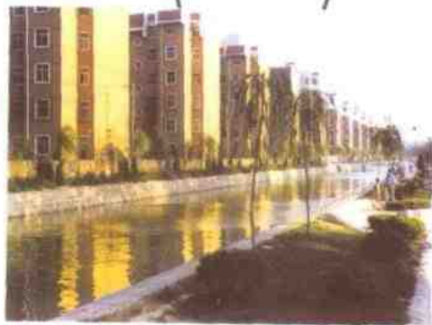
景色宜人的天苑小区