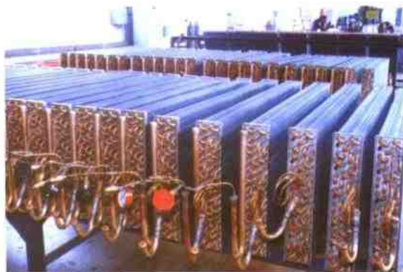
国铁分厂生产的换热器系列产品