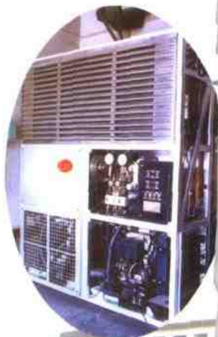
国铁分厂生产的铁路运输“蓝鲸”制冷机组

引进德国制冷技术和英、美先进设备，生产制造的铁路运输制冷机组，填补了国内铁路运输制冷制造技术的空白。经过多年的技术研发，现已成为设计并制造铁路、公路机械冷藏机组、冷板车机组、水果冷库机组等系列产品的专业厂家。与台商合资的石家庄国祥制冷设备有限公司设计制造的铁路客车、机车司机室空调机组；最新研制的高速列车、地铁轻轨车空调机组分别装配广深线、上海明珠线。国祥公司已获得英国摩迪公司颁发的ISO9001质量体系认证证书，成为国内铁路机、客车空调主要供应商之一，机、客车空调市场占有率分别达到70%、40%并且是法国阿尔斯通公司的A级供应商。