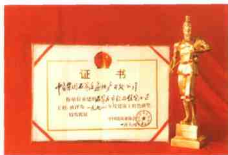
国家建筑工程鲁班奖。

贡献最大： 作为石家庄的市民，现在出行最大的感受就是这些年石家庄的道路四通八达，更宽了、更顺了，高楼大厦鳞次栉比，更多了、更美了，这其中也有“大开发”人默默的奉献：从原长安路、解放路拓宽到火车站广场改造、自强路打通，从中山西路、裕华西路、中华北大街拓宽到省科技馆、省艺术中心的建设。为了让石家庄的天更蓝、树更绿、水更清，他们还投资数千万元兴建了自强路、天苑两个集中供热站，拔掉了一大批小烟囱，为石家庄市的环保事业贡献了力量。