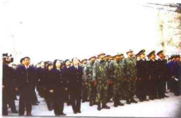
配送中心开业时，公司全体职工