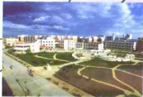
荣获鲁班奖和城市住宅小区