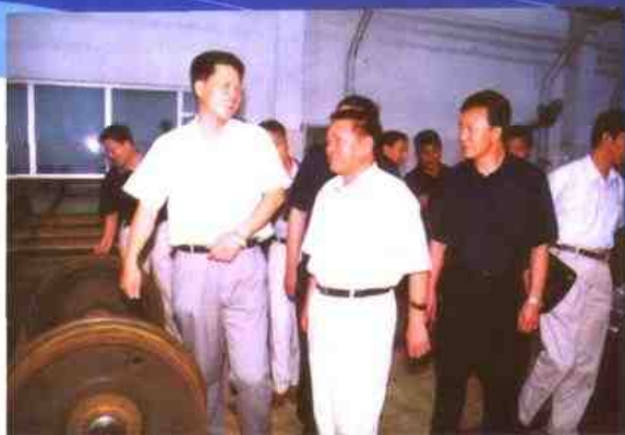
石家庄市市长臧胜业视察工厂