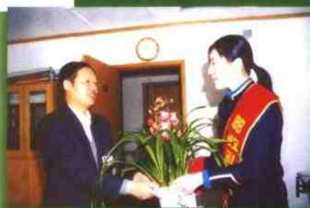
邮政礼仪小姐送花上门

邮电分营以来，市邮政先后获得市级以上各种荣誉55个，其中省级以上的有“全国用户满意服务单位”、“全国创建文明行业工作先进单位”、“河北省文明单位”、“河北省消费者协会第六届消费者信得过单位”、“思想政治工作优秀企业和优秀政研会”、“职业道德建设先进单位”、“讲文明、树新风活动先进单位”等，长安邮政营业班荣获了“全国五一劳动奖状”、“全国创建文明行业工作先进单位”，并被授予“全国精神文明创建活动示范点”，维明邮政营业班荣获了“河北省跨世纪建功立业先进班组”、“河北省先进集体”和荣获“全国五一劳动奖章”、“河北省劳动模范”称号的樊先遒等先进个人。