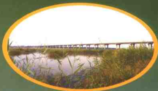
京石线薄沱河特大桥