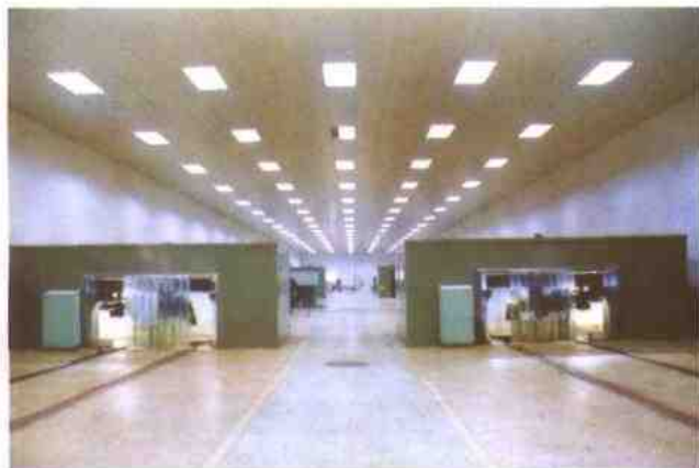
铁路车辆走行部检修生产线