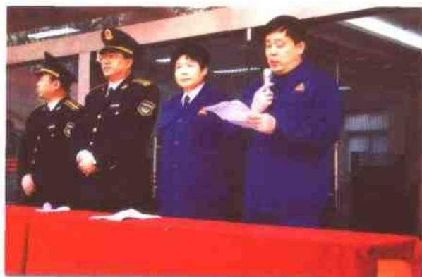
配送中心开业时，全体班子成员

同时按照国家烟草专卖局的统一部署，进行了大规模的卷烟销售网络建设，全区建成农村批发网点94个；建立了卷烟配送中心、访销中心、专卖稽查中心三个中心；实现了经营、交通、通讯、安全、生活五项设