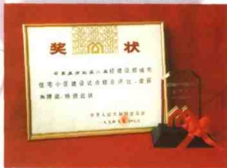
建设部城市住宅小区建设试点金牌奖。