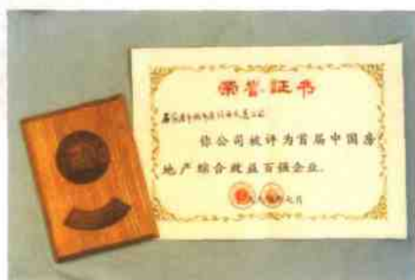
全国房地产开发企业综合实力一百强。