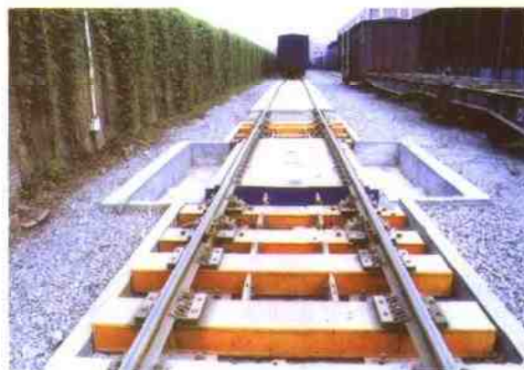
合资企业铁龙电子计量设备有限公司生产的不断轨超偏载电子轨道衡