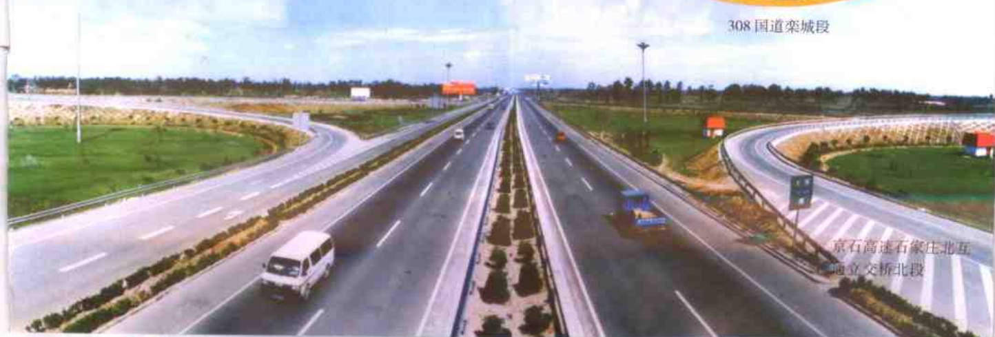
京石高速石家庄北互通立交桥北段