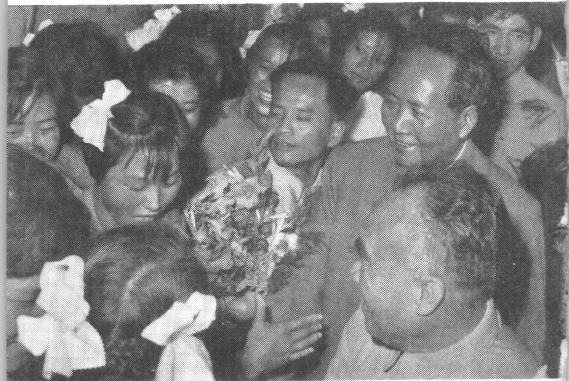
運動員向毛主席獻花致敬