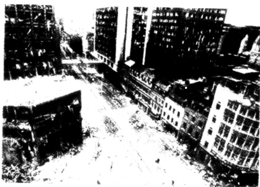
84年,美驻贝鲁特使馆被炸