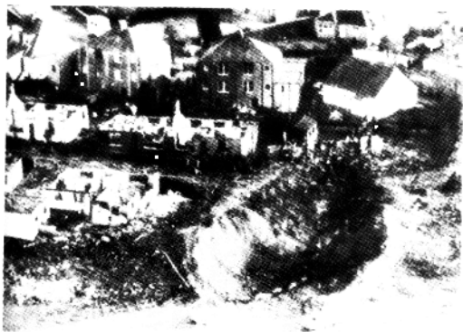
88年洛克比空难,飞机在地面撞出 30码长,50码深的大坑