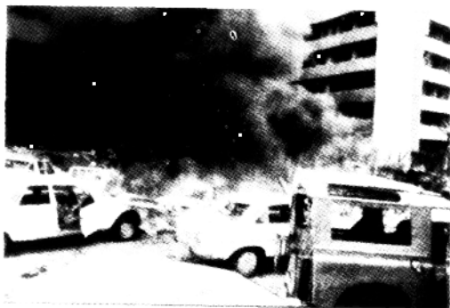
爆炸现场,浓烟冲天