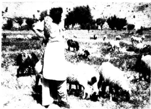
拉登在阿富汗的“根据地”——一片贫瘠的土地