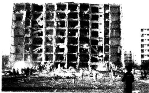
95年俄州联邦大厦被炸现场