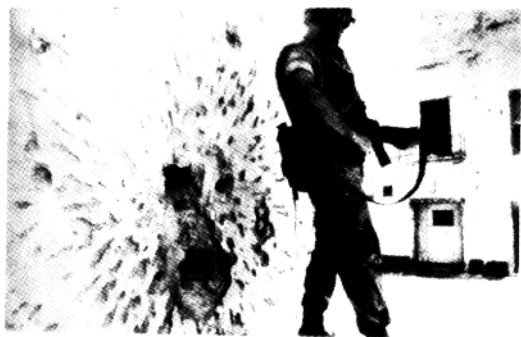
美驻肯使馆被炸现场