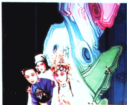
市评剧院青年评剧团演的《花为媒》剧照