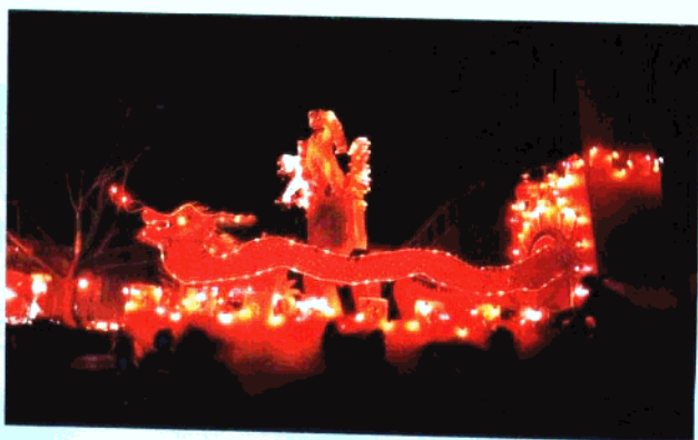
元宵灯展《巨龙腾飞》