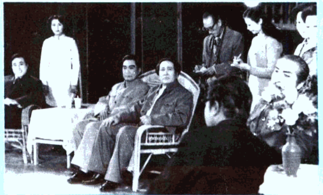
市文工团演出的话剧《西安事变》剧照。