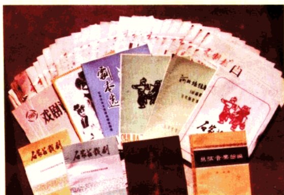
石家庄市文化局编印的部分书刊