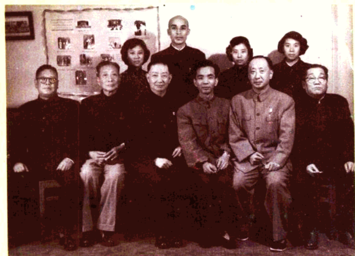
1959年，市京剧团杨玉娟、杨淑芬、林丽娟、穆祥斌在北京分别拜梅兰芳、马连良、李多奎、裘盛荣为师。图为师徒合影