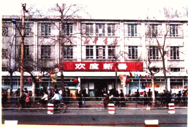
石家庄市新华书店长安路书店

市新华书店所属综合性零售门店之一。营业面积448平方米,实行开架售书。主要经营社会科学、文化教育、大中专教材、文学艺术、科学技术类图书及少儿读物、音像制品、文教用品等。