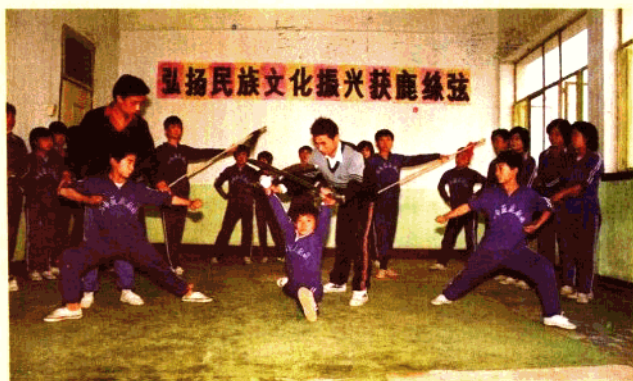
获鹿县丝弦剧团学员班练功照