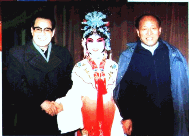
河北省委书记邢崇智、副书记李文珊观看市评剧院一团演出的《花魁女与卖油郎》演出结束后,与该团主演尚丽华合影留念。