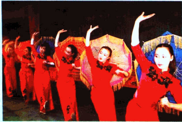
市歌舞团演出的舞蹈《山里的妹子》

中共中央政治局常委李瑞环,在观看市评剧院青年评剧团演出的《杨三姐告状》后,上台接见演员,并与该团主演、青年评剧表演艺术家刘秀荣及其老师新风霞亲切交谈。