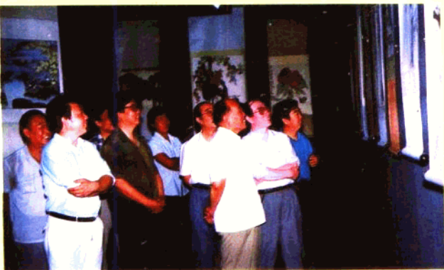
河北省委书记邢崇智等参观在市博物馆举办的“花鸟画展”。