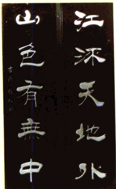
张松龄的书法作品