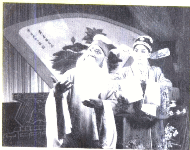
市丝弦剧团演出的《白罗衫》剧照