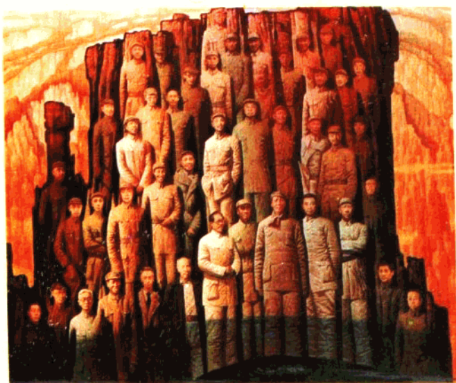
陈承齐的油画《迎着曙光》