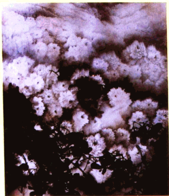
董贵堂的国画《舞深悠远》