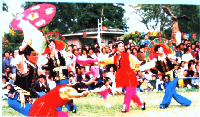
井陘民间舞蹈“拉花”