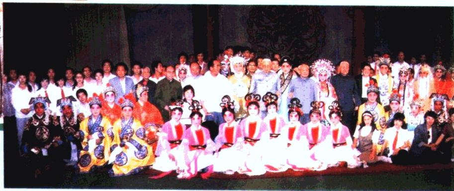
1987年,市青年评剧团在北京中南海怀仁堂演出。剧终后,宋任穷、余秋里、黄镇、王平、马文瑞、高占祥、张百发等领导与全体演职员合影。