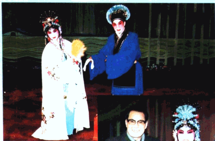
市评剧院一团演出的《花魁女与卖油郎》剧照