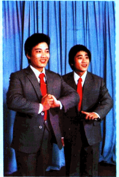
业余曲艺演员表演相声《旅行结婚》