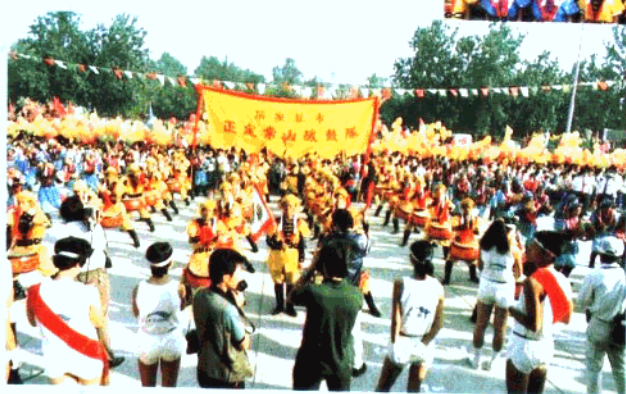
1990年正定“常山”战鼓队 在北京为第十一届亚运会表演