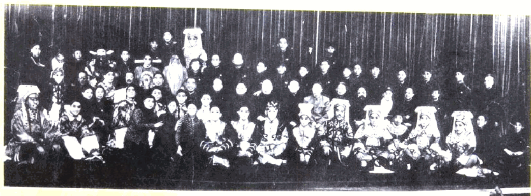
1957年，市丝弦剧团在北京中南海怀仁堂演出。剧终后，朱德、周恩来、邓小平、陈毅、贺龙等领导与全体演职员合影。