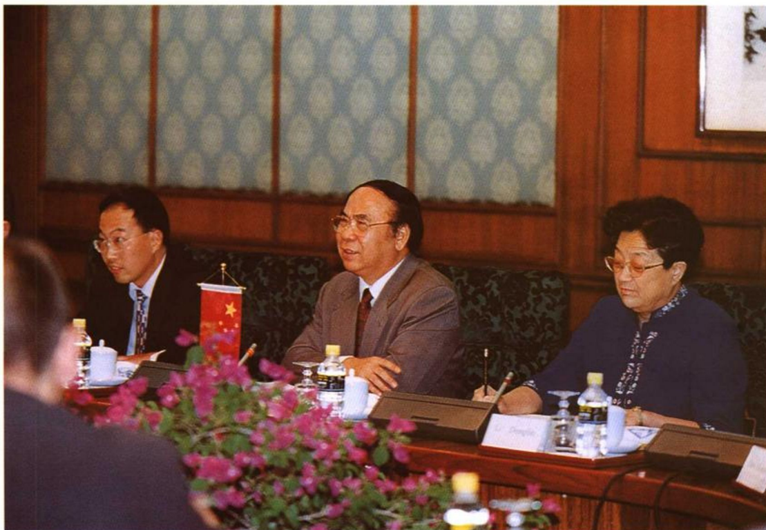
2001年7月12日，劳动保障部副部长李其炎、王建伦与来华访问的德国联邦劳工和社会事务部部长瓦尔特·里斯特进行工作会谈。