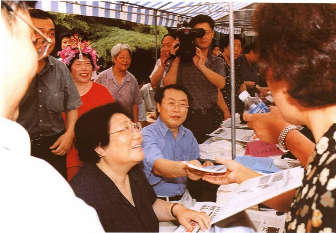
2001年6月，按照劳动保障部统一部署，全国各地展开了一次声势浩大、形式多样的劳动保障政策宣传咨询活动。6月10日，劳动保障部部长张左己、副部长王东进分别到设在北京市东城区和平西街和西城区长安商场的宣传咨询点参加了北京市劳动保障局组织的社会保险政策宣传咨询活动。图为张左己部长在北京市东城区和平西街宣传咨询点为群众发放宣传材料。