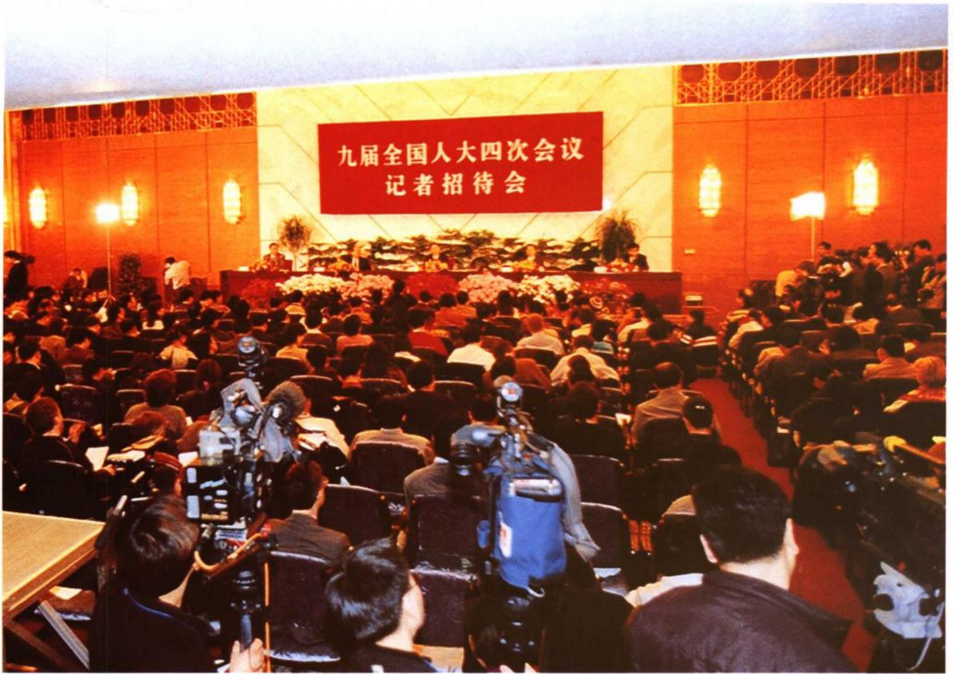
2001年3月10日，九届全国人大四次会议举行记者招待会，邀请劳动保障部部长张左己就劳动保障工作回答了中外记者的提问。图为记者招待会场景。