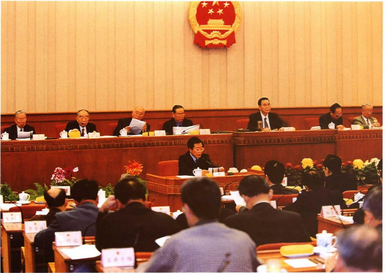
2001年10月26日，受国务院委托，劳动保障部部长张左己在第九届全国人大常委会第二十四次会议上，向九届全国人大常委会报告完善社会保障制度情况。图为九届全国人大常委会听取和审议张左己部长的报告。