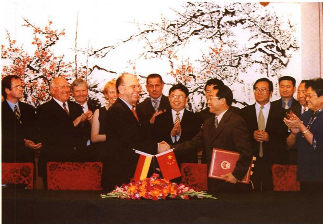
2001年7月12日，劳动保障部部长张左己与德国联邦劳工和社会事务部部长瓦尔特·里斯特在北京钓鱼台国宾馆共同签署了《中华人民共和国与德意志联邦共和国社会保险协定》，这是我国社会保险领域对外签署的第一个社会保险协定。