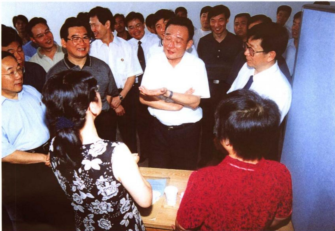
2001年7月18日，中共中央政治局委员、国务院副总理吴邦国在湖北视察宜昌市劳动力市场。他希望全体工作人员再接再厉，做好劳动力市场各项工作，把“有求必应，全程服务”真正落到实处。