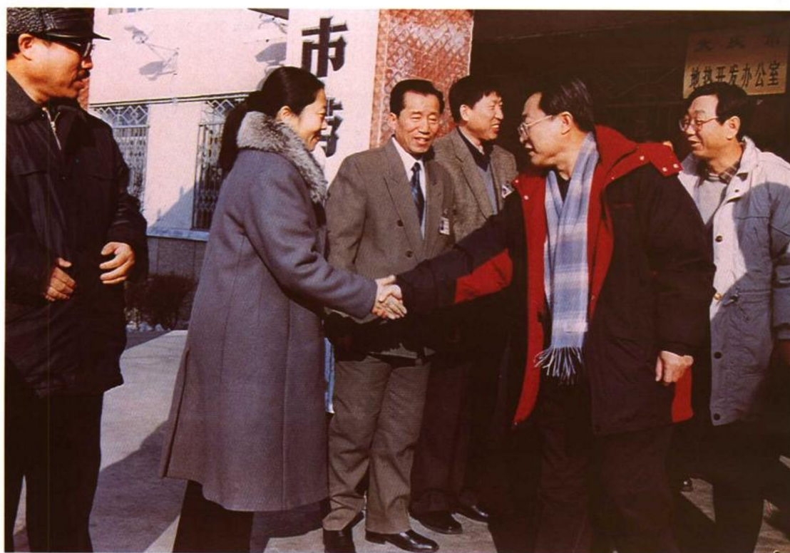
2001年1月8日至12日、20日至21日，劳动保障部部长张左己先后到四川成都、广西南宁和柳州、黑龙江大庆和哈尔滨等地检查慰问。图为张左己看望柳州针织总厂退休工人(上图)和大庆市劳动保障局工作人员(下图)。