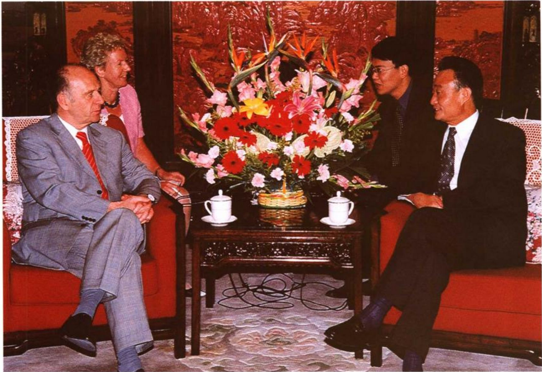
2001年7月13日，国务院副总理吴邦国在中南海紫光阁会见了来访的德国联邦劳工和社会事务部部长瓦尔特·里斯特。他说，中德友好关系推动了两国经济合作的进一步发展。中德之间存在着广泛的经济交流与战略合作，双方应在劳动和社会保障方面交流经验。