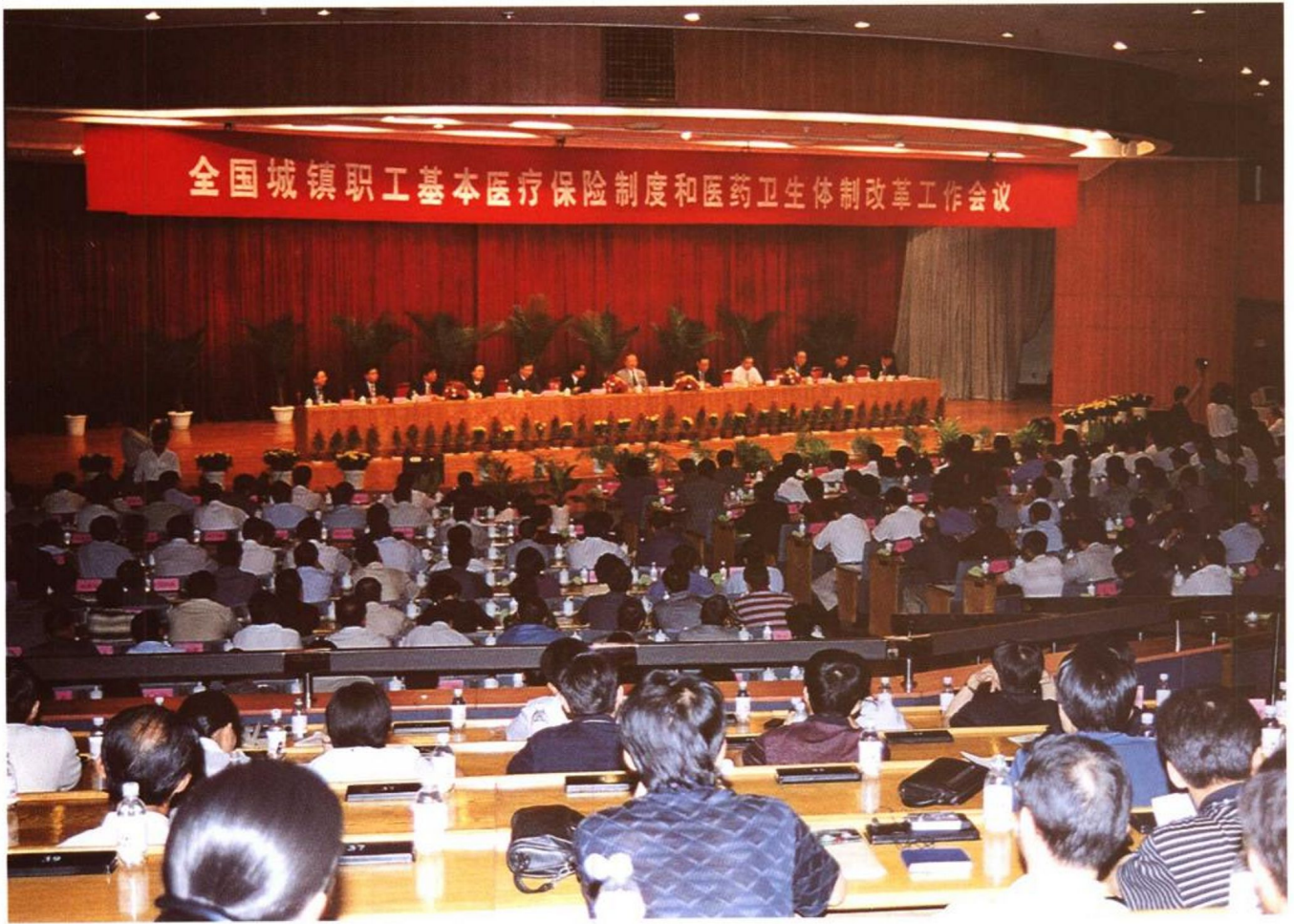
2001年7月28日至30日，国务院在青岛召开全国城镇职工基本医疗保险制度和医药卫生体制改革工作会议，中共中央政治局常委、国务院副总理李岚清出席会议并作重要讲话。图为会议场景。