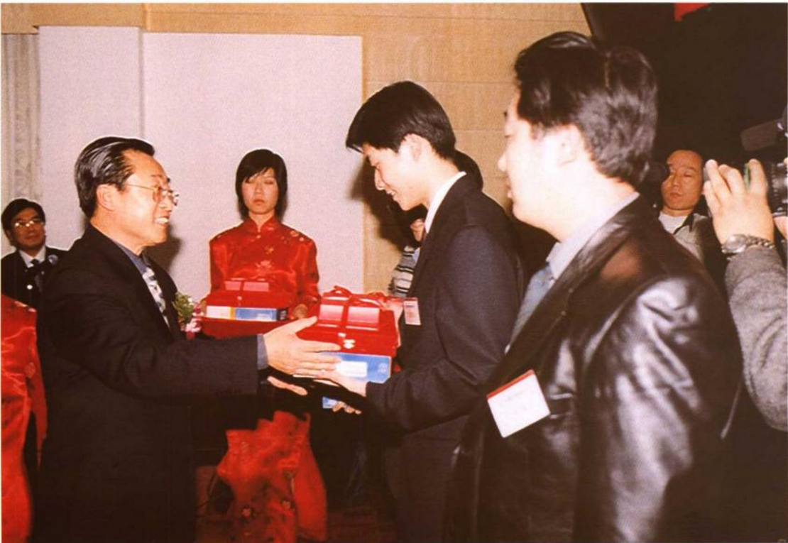
2001年12月20日，劳动保障部主办、信息产业部协办的全国首届计算机应用大赛在京圆满结束。劳动保障部部长张左己、副部长林用三，信息产业部有关代表，中国计算机学会名誉理事长张效祥等出席颁奖仪式。获本次大赛决赛前5名的选手被授予全国技术能手荣誉称号，部分优秀选手还获得了全国计算机高新技术考试证书。江苏、北京、天津、安徽、湖北等省市因组织工作出色受到表彰。图为张左己部长为获奖选手颁奖。