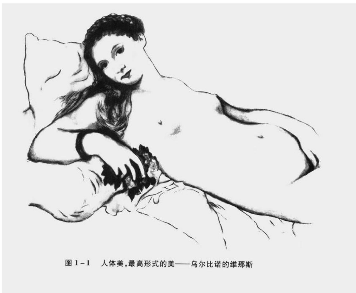
图1-1 人体美,最高形式的美——乌尔比诺的维那斯

人体的自然形成之美,是人类在自然进化与生产劳动相结合的漫长历史进程中,而逐步发展形成的一种美,是一种“无与伦比之美”,是“大自然中最美的东西”,是最高形式的美(图1-1)。