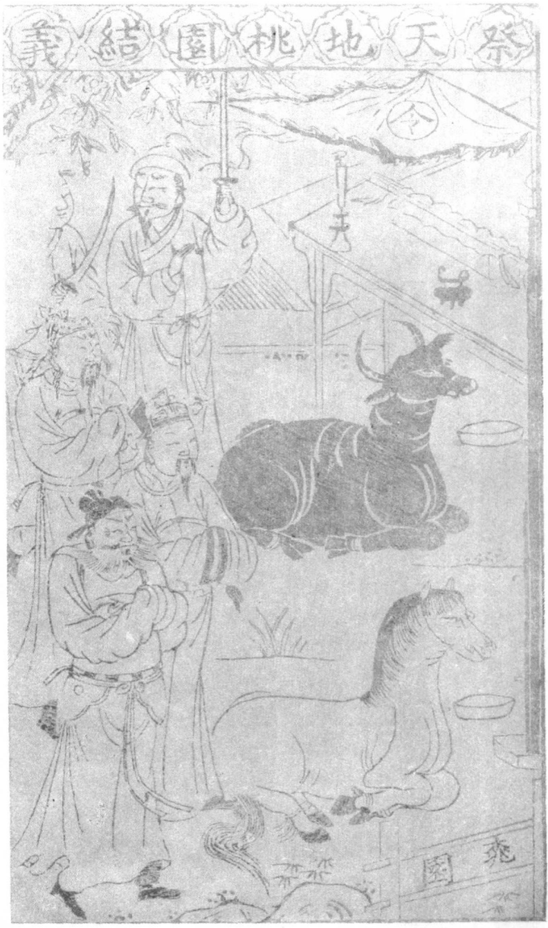
（本刊補以鄭國明）七圖插『化演的義演志國三』