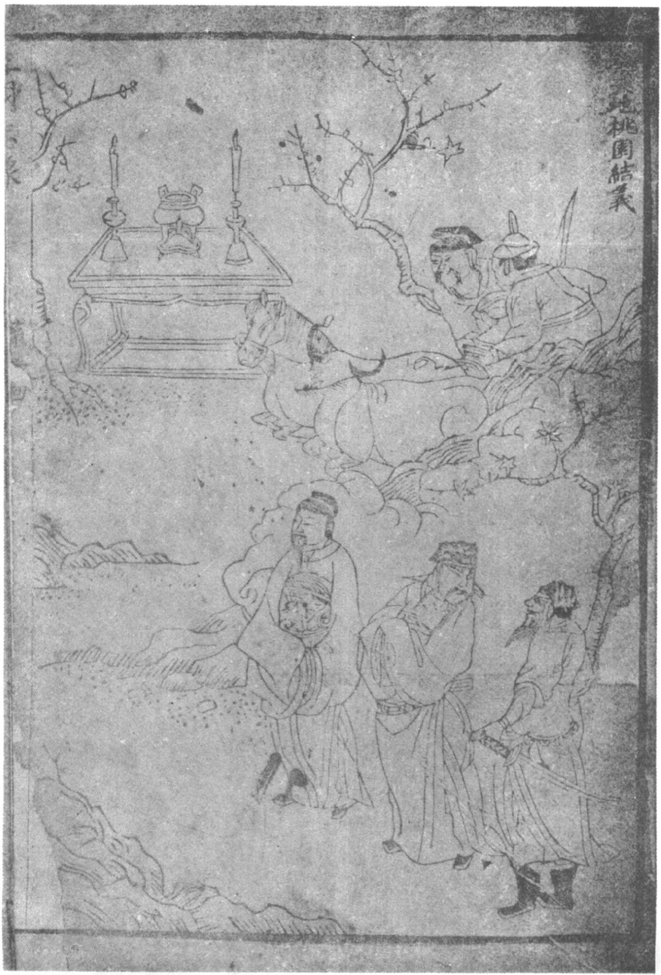
（本評吾學李刊郡吳）八圖插【化演的義演志國三】