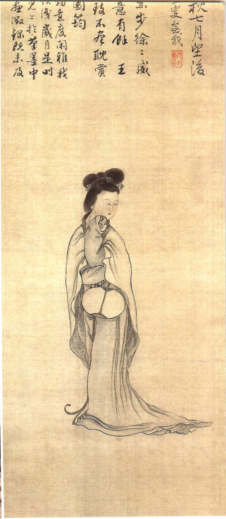
1. 清·陈宇 扑蝶仕女图 2. 清·王树谷 朝妆缓步图