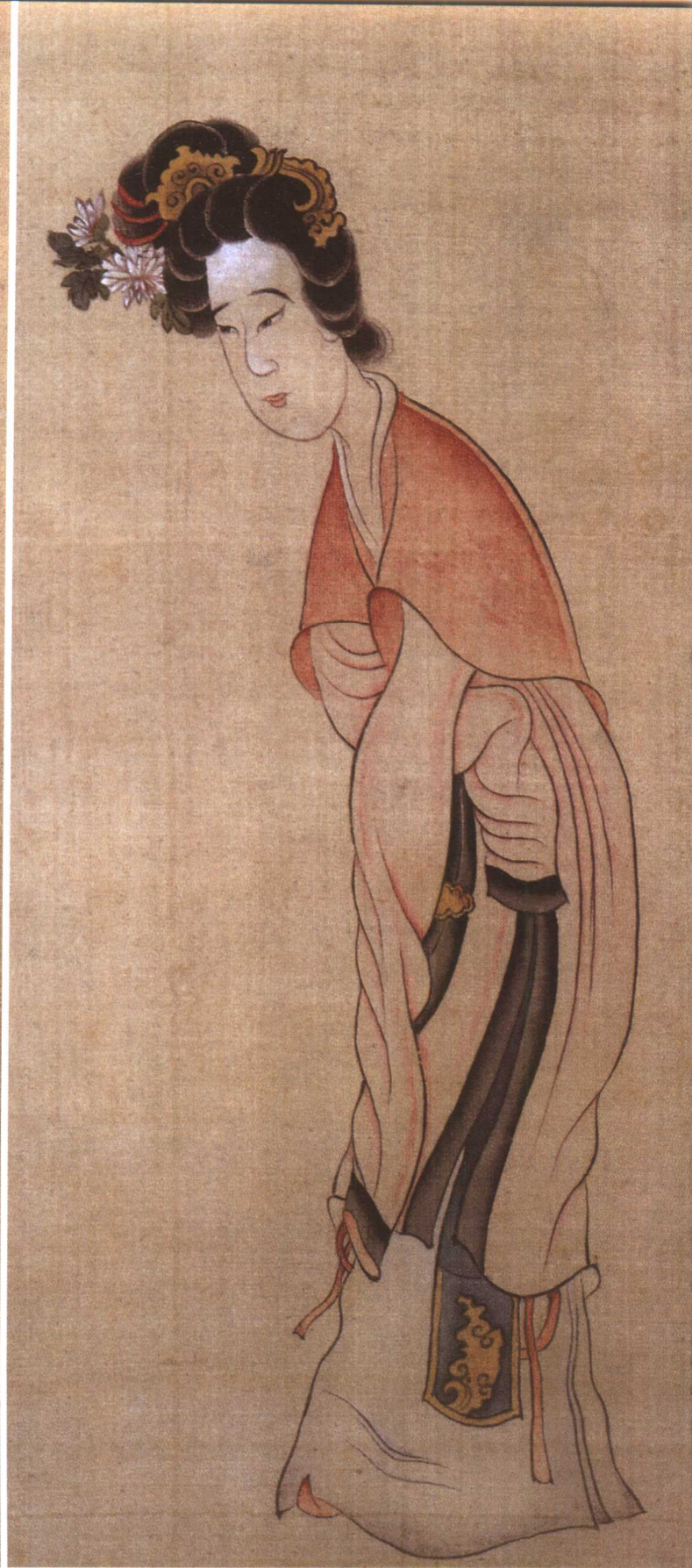
1. 明·陈洪绶 拈花仕女图