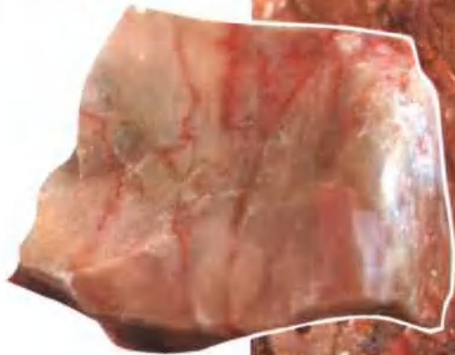
6、鸡血原料石 鸡血石材