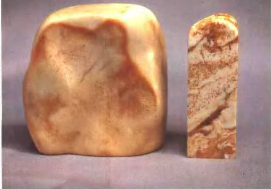
30、黑花石 (左) 红花石 (右) 黑花石 (左) 紅花石 (右)