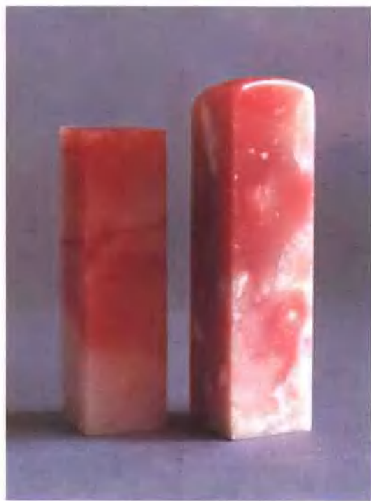
20、瓜瓢红 (左) 芙蓉冻 (右)

瓜瓢紅 (左) 芙蓉凍 (右) 在线购买: www.ertongbook.com