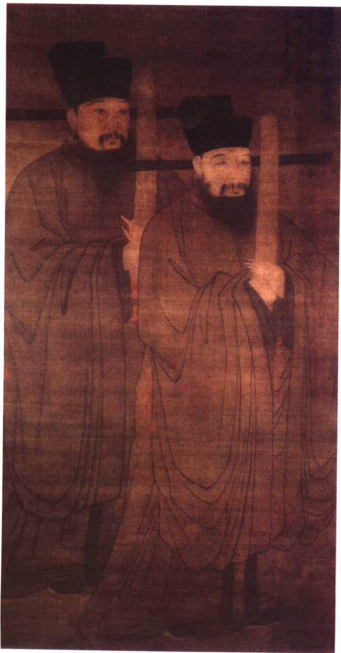
范文正公與次子忠宣公（純仁）像