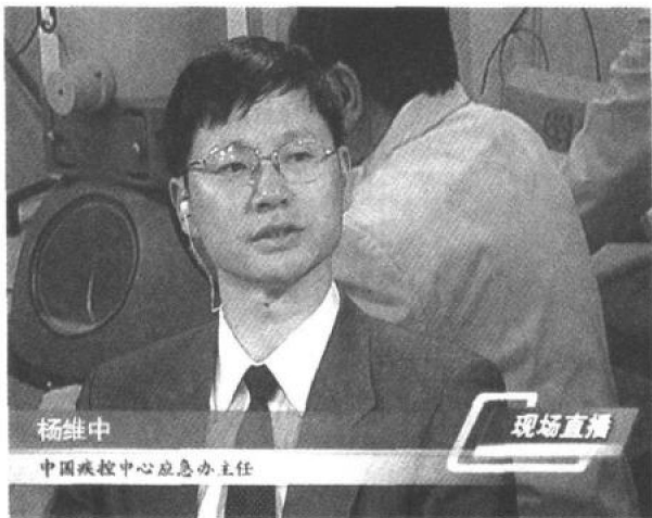
中国疾控中心应急办主任

的老百姓都已经非常熟悉了,因为从第一例发病到现在已经有几乎半年的时间,这个时候我想有必要我们再回头去看一下SARS到底是什么?两位(嘉宾)都是医学方面的专家,我们特别想知道在你们的眼里SARS真的如很多人想象的那么严重吗?