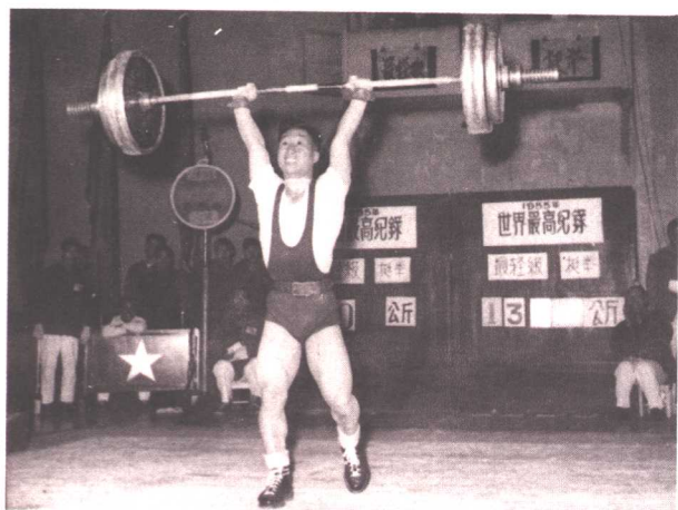
我国第一个打破世界纪录的陈镜开