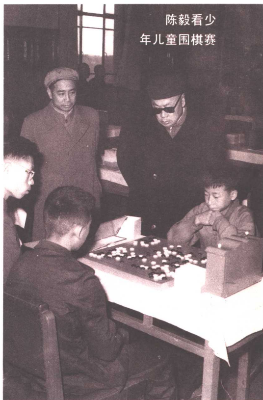
陈毅看少年儿童围棋赛