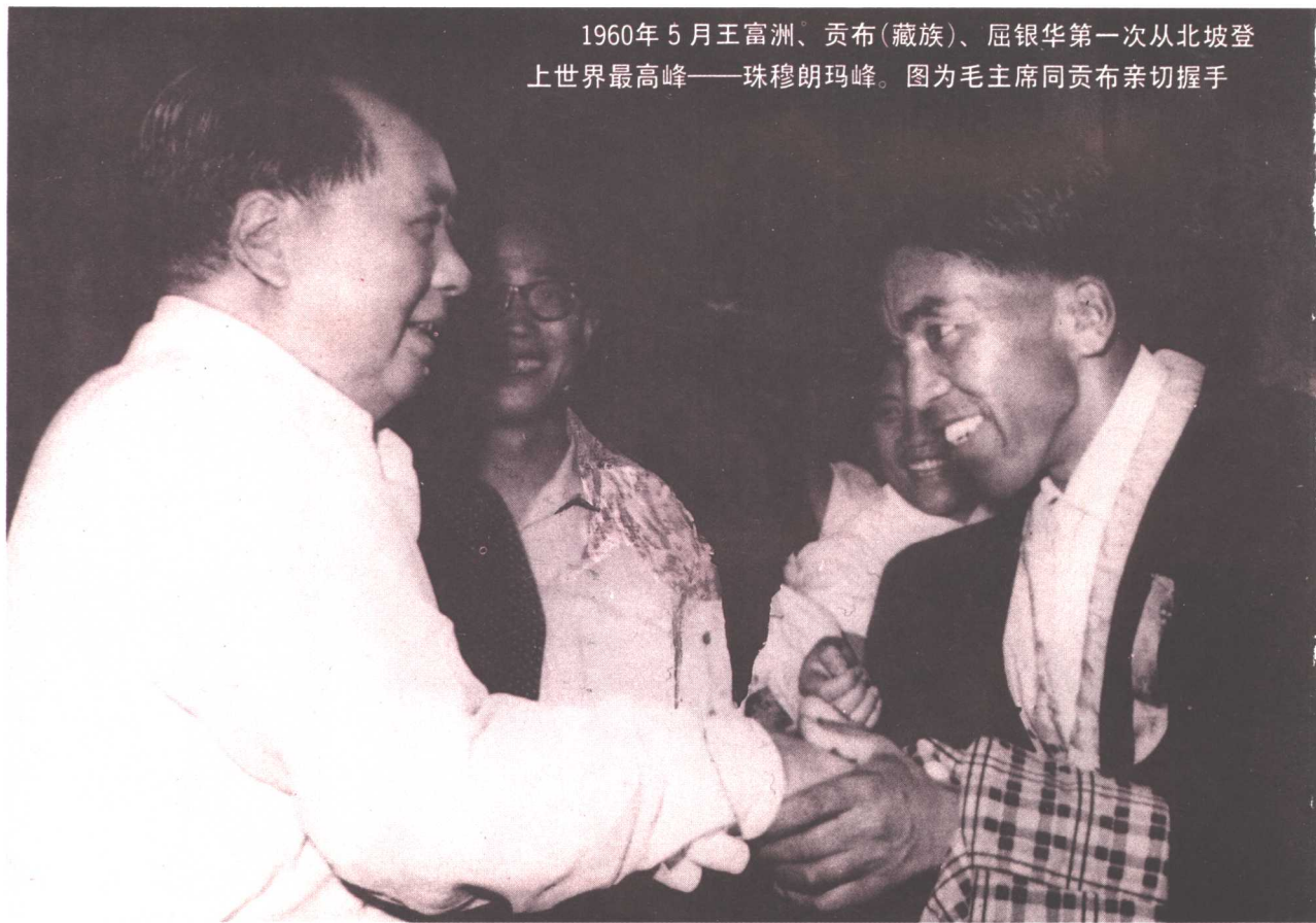
1960年5月王富洲、贡布(藏族)、屈银华第一次从北坡登上世界最高峰——珠穆朗玛峰。图为毛主席同贡布亲切握手