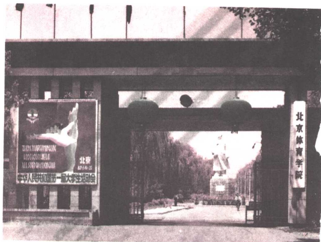
我国规模最大的体院——北京体育学院