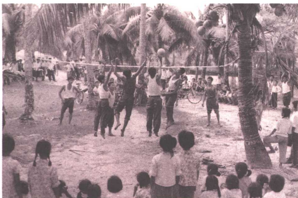
我国群众体育运动蓬勃开展，这是人们打球、做操、练拳。