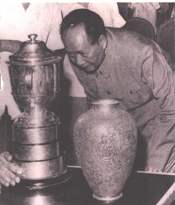
毛主席观看我国乒乓球健儿在世界锦标赛上获得的奖杯