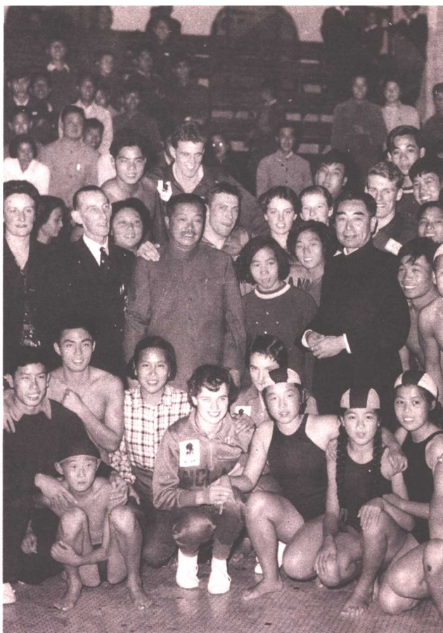
周恩来、贺龙会见中英游泳运动员