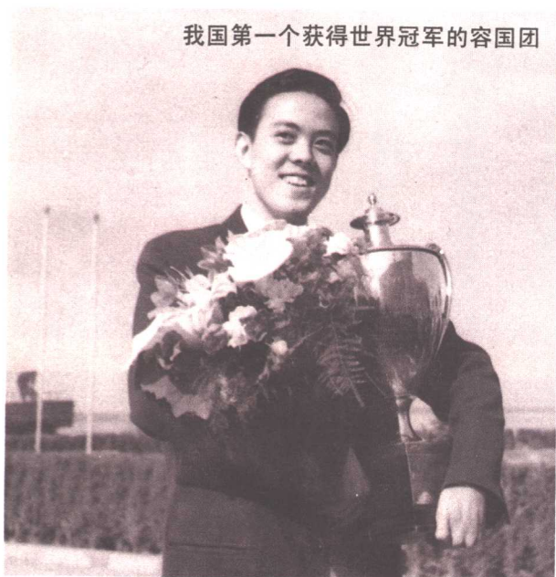
我国第一个获得世界冠军的容国团