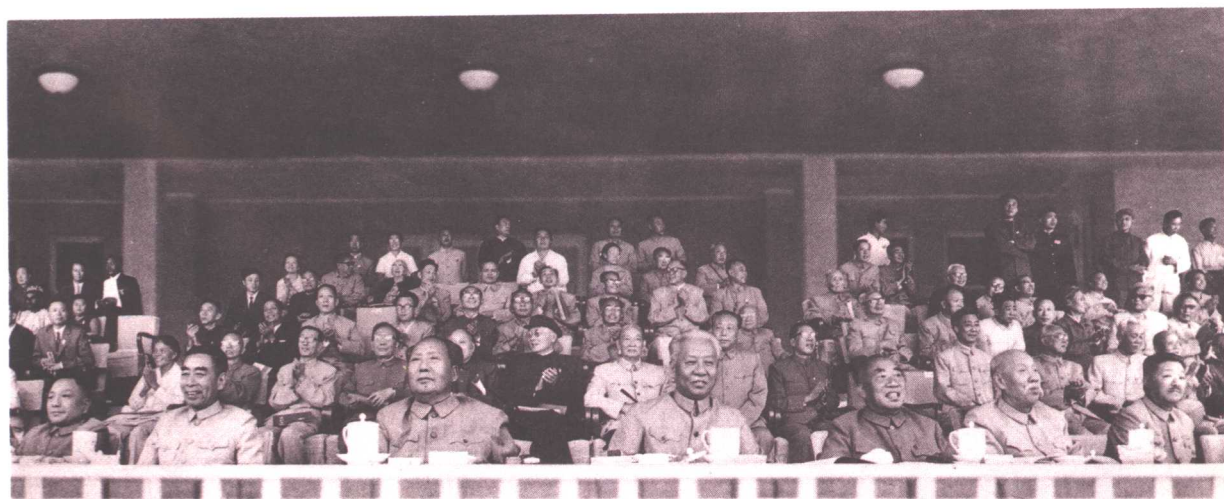
党和国家领导人出席第二届全国运动会