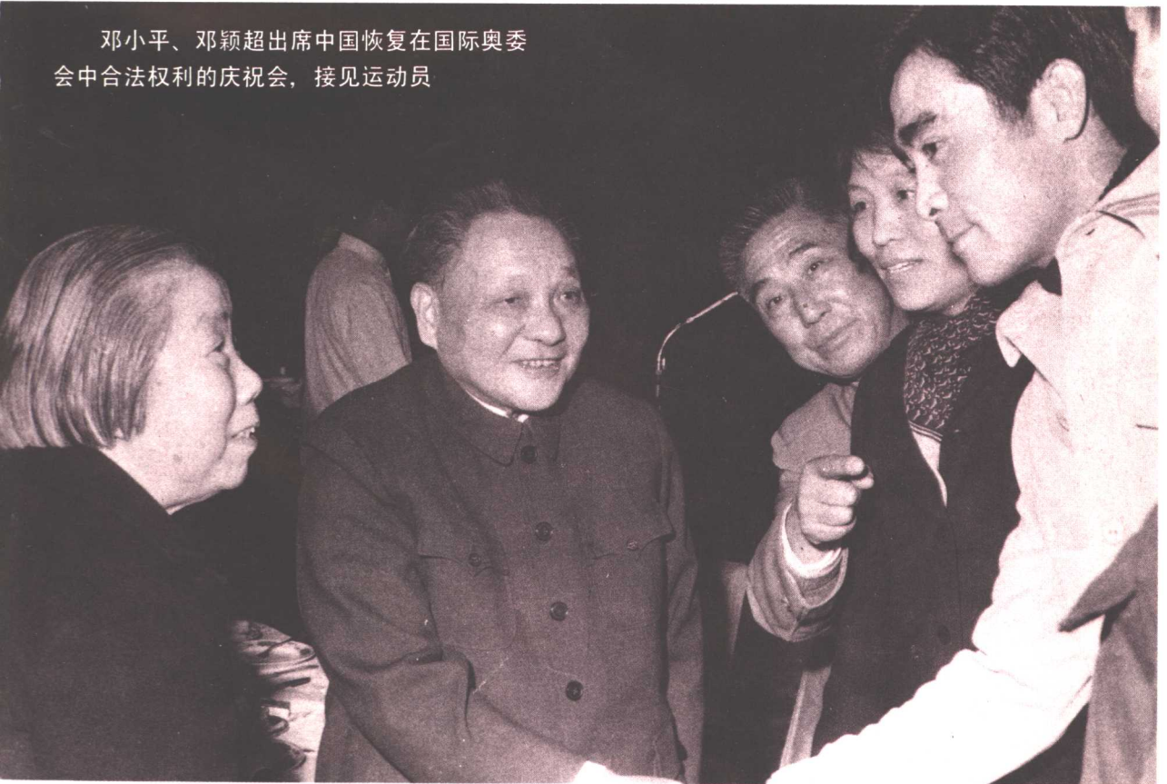
邓小平、邓颖超出席中国恢复在国际奥委会中合法权利的庆祝会，接见运动员