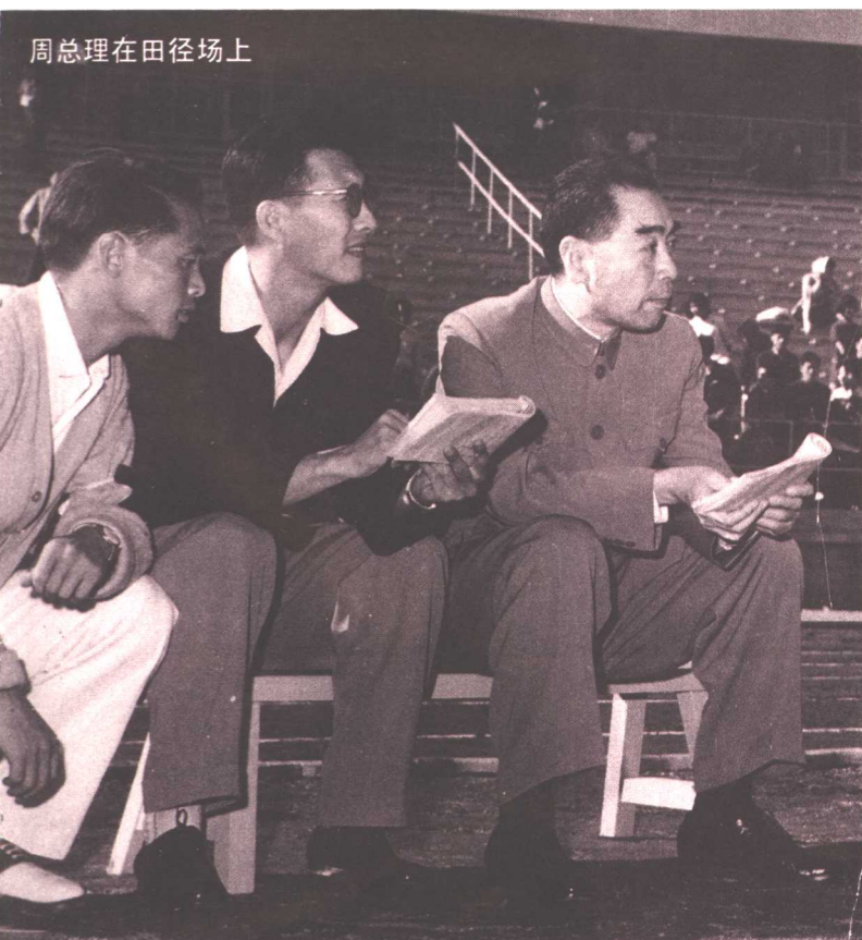
周总理在田径场上