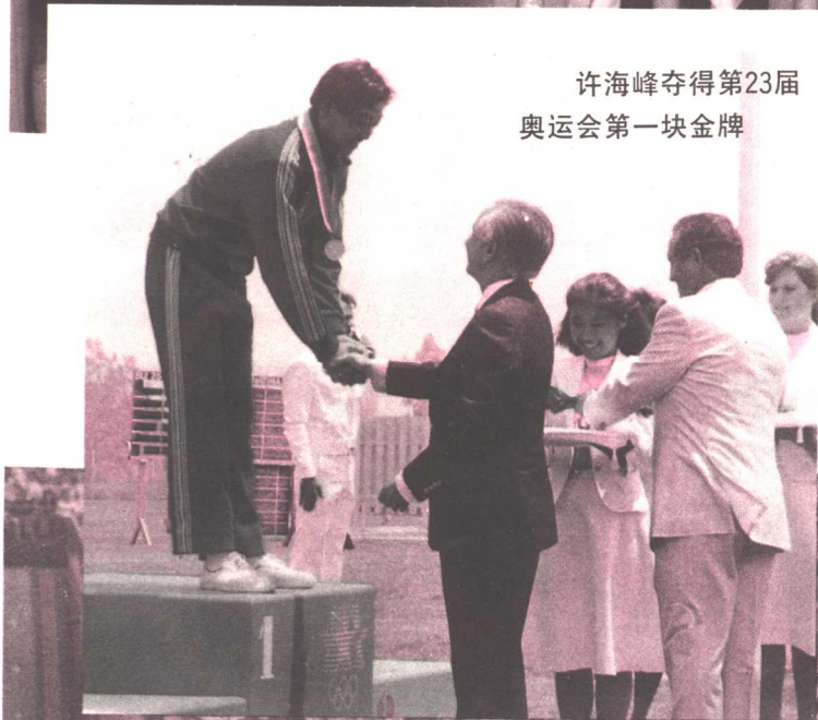
许海峰夺得第23届奥运会第一块金牌