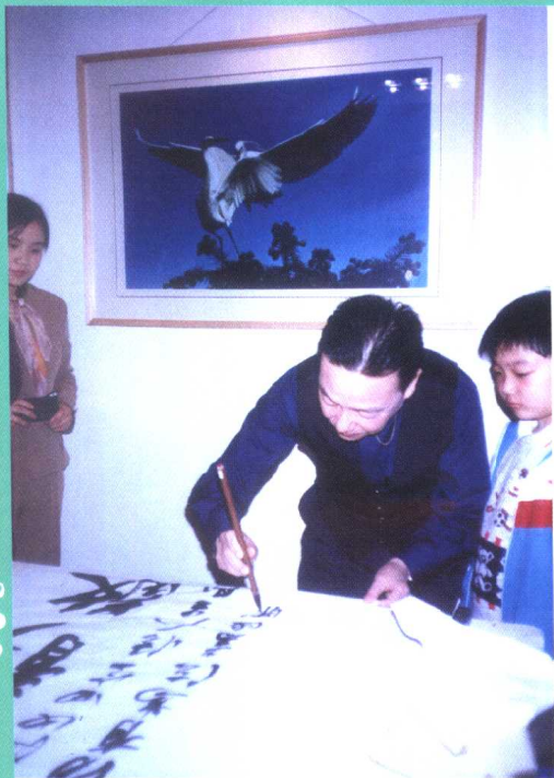
◀ 著名诗人、书画家、茶人陈云君先生在挥毫泼墨。