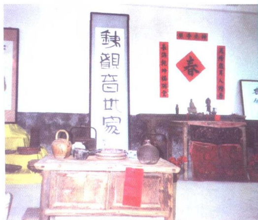
▶ 铁观音传统的泡茶用品，已经成为收藏品。