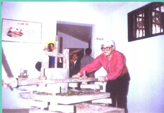
◀ 传统的揉捻工具照样可以制茶