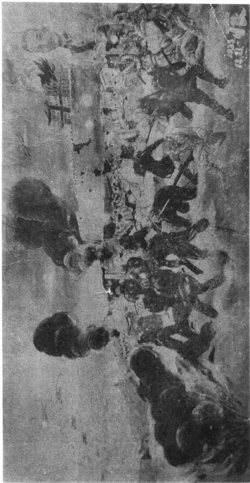
一九三三年之榆关抗日战争（宋一痕作）