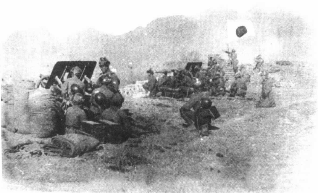
▲ 日本侵略军炮击山海关