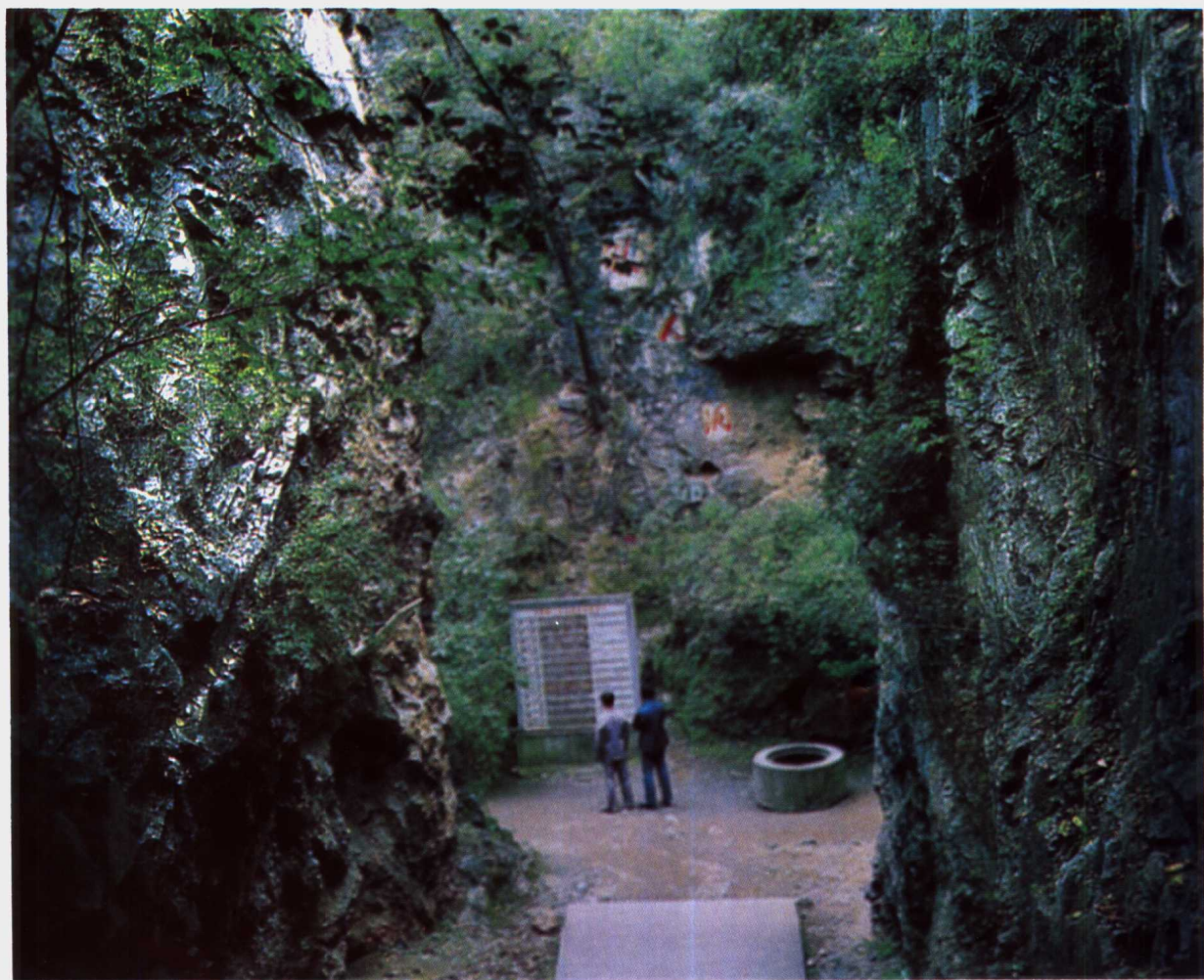
北京周口店猿人洞