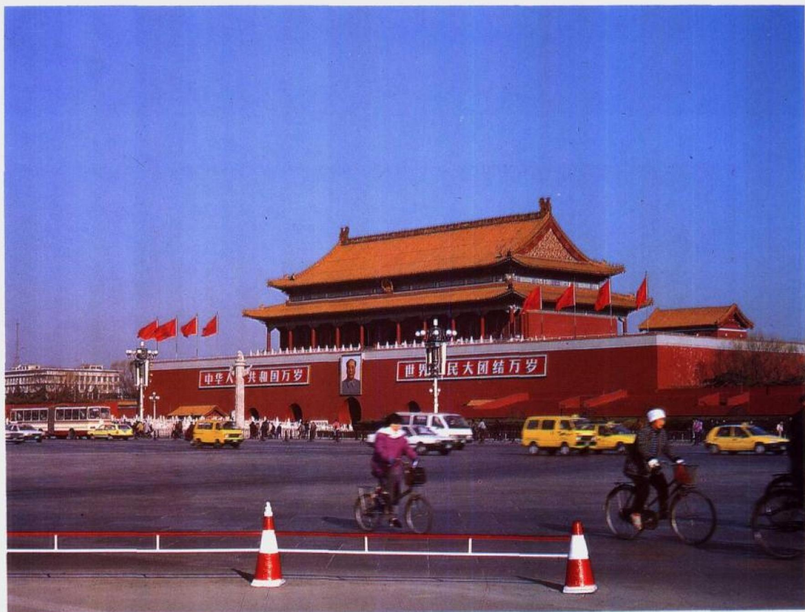
天 安 门