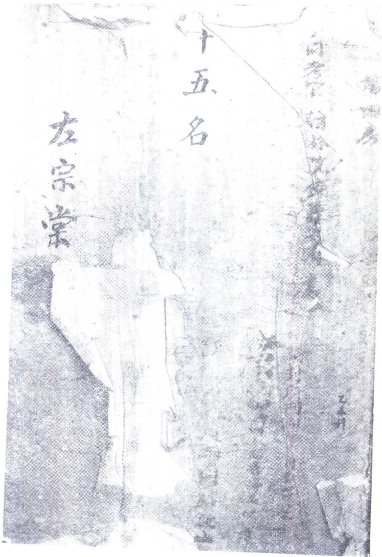
乙未科会试卷封面（湖南省图书馆藏）