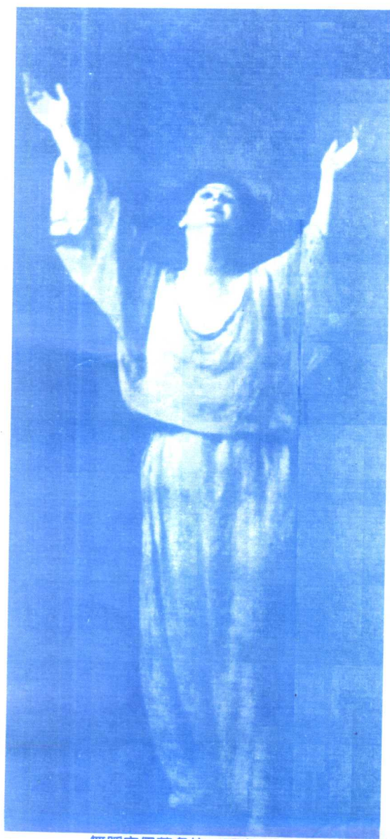
舞蹈家伊莎多拉·邓肯