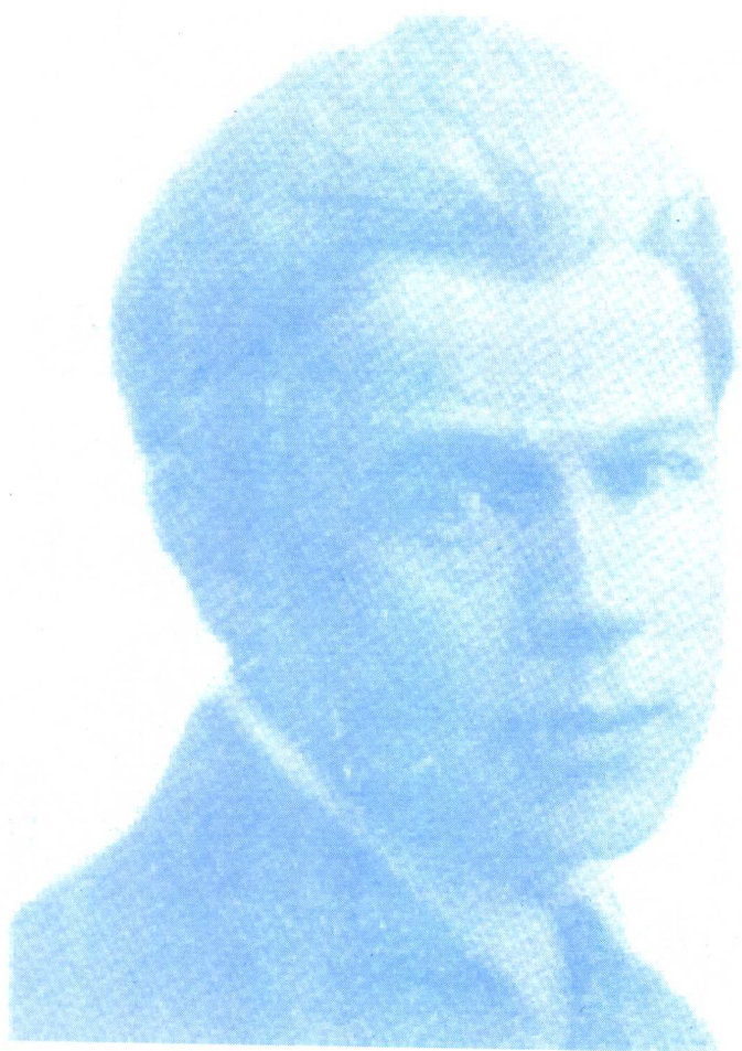
俄罗斯诗人 叶赛宁,唯一与邓肯结过婚的人