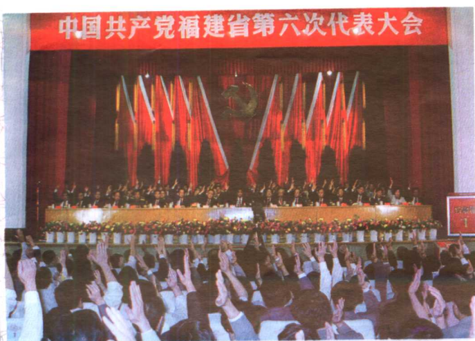
● 中共福建省第六次代表大会 1995.10.15 在福州西湖宾馆礼堂隆重举行。