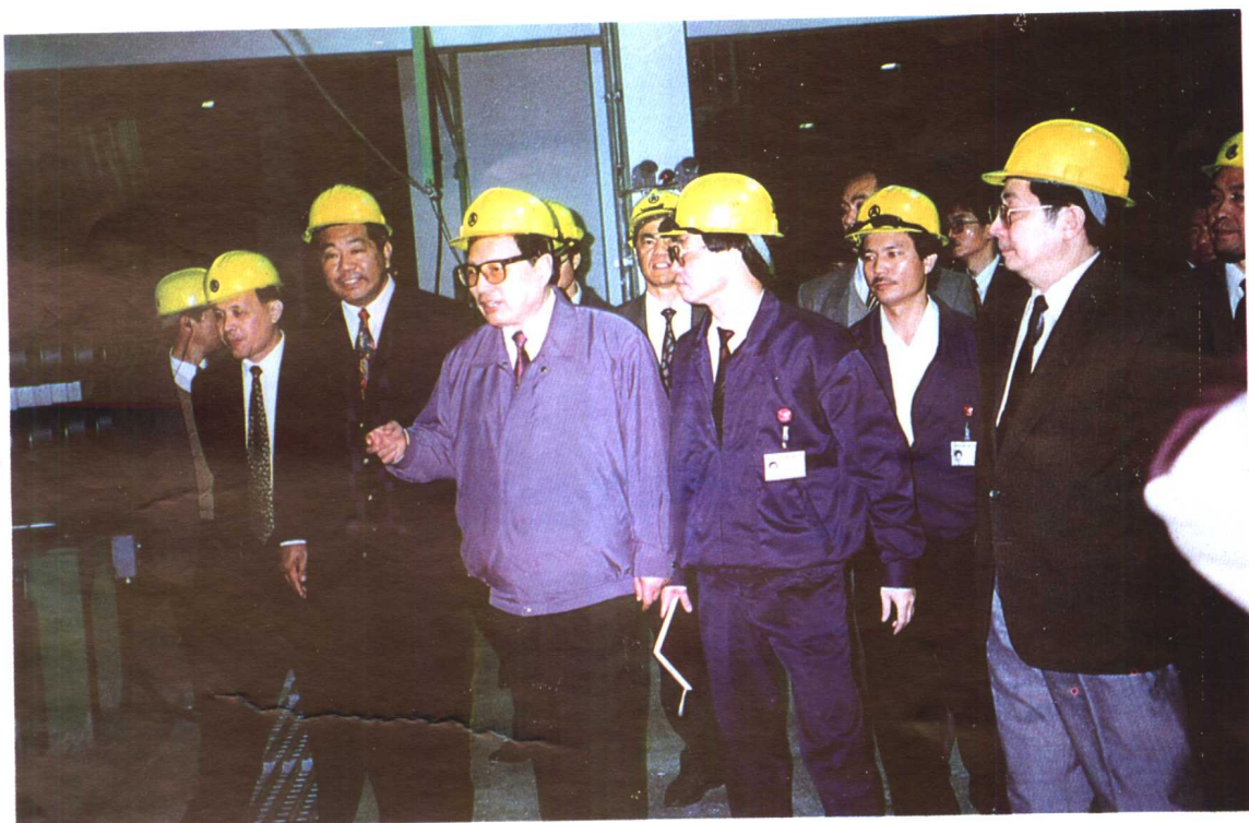
● 1995年3月乔石委员长在省委书记贾庆林、省长陈明义的陪同下,先后视察福州、厦门、漳州等地。