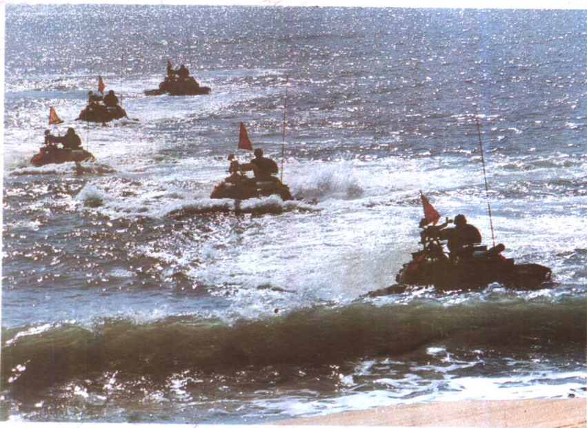
● 冲向滩头

● 1995年11月下旬,南京战区陆海空部队在闽南沿海地区成功地举行了一次三军联合作战演习,展示了参演部队良好的军事素质和高昂的士气;再次显示我军有决心、有能力保卫国家主权和领土完整。