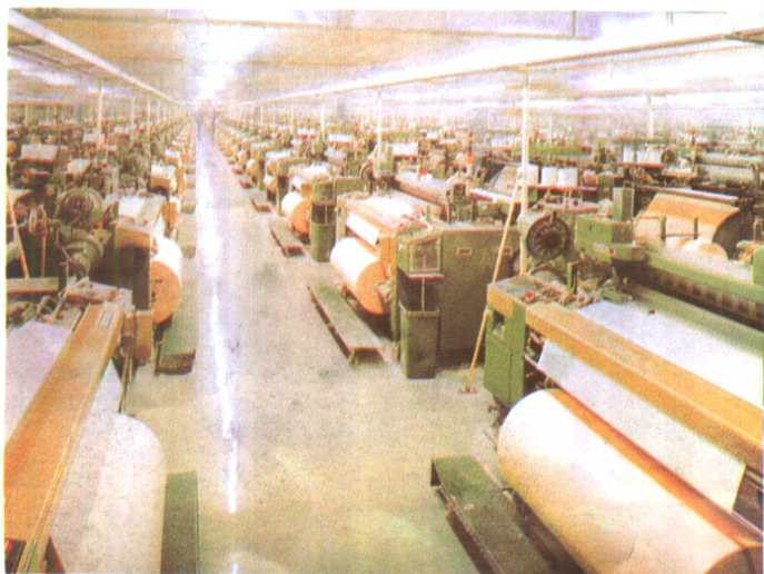
噴氣織機車間 Air Jet Loom