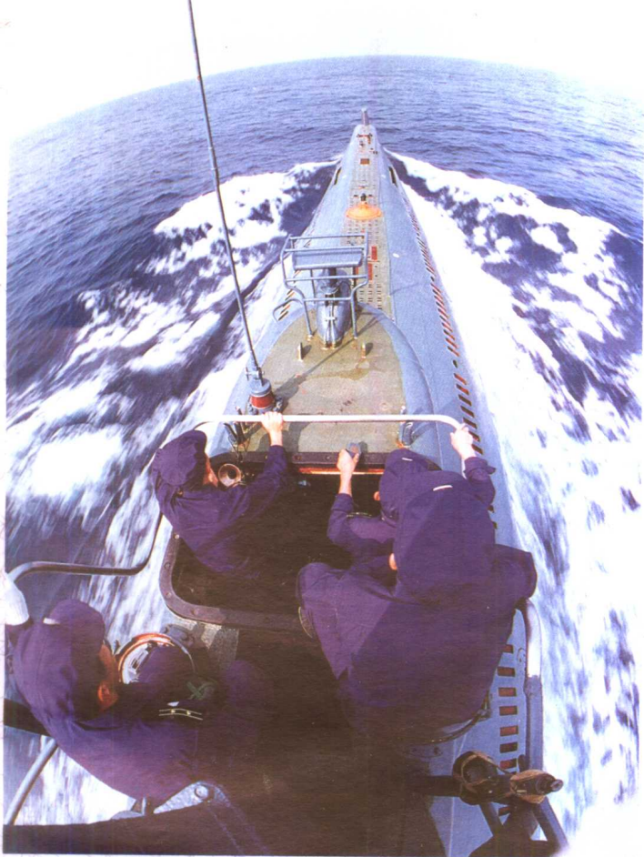
● 骑“鲸”滔海。