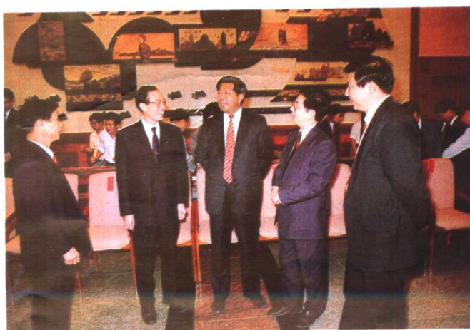
● 在中共福建省六届委员会第一次全会上贾庆林当选省委书记(左三),陈明义(右二)、何少川(左二)、习近平(右一)、林兆枢(左一)当选副书记