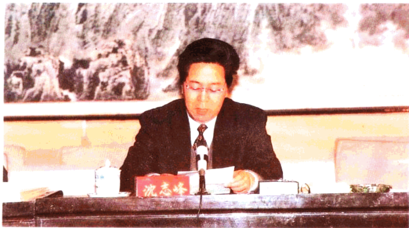
1995年3月， 沈志峰市长在全市 土地使用制度改革 工作会议上讲话