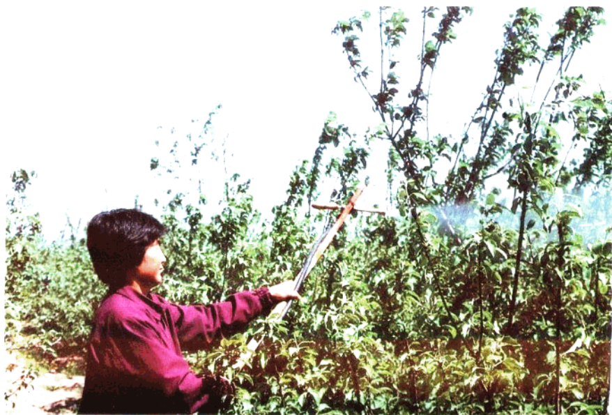
“开荒女状元” 辛集市南小陈村农 民张品在为开发的 百亩果园喷施农药