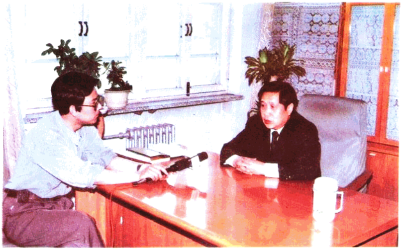
1993年2月， 国家土地管理局原 局长王先进视察市 土地管理局工作时 题词