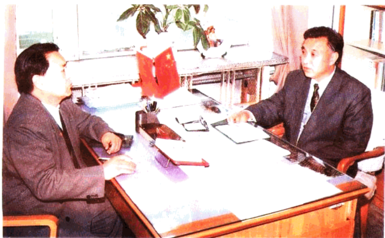
市土地管理局 领导向市委副书记 彭造岭(右)汇报工 作