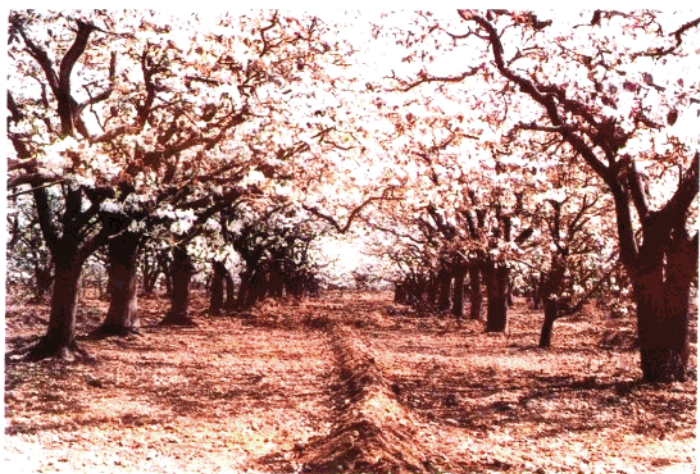
黄土地上的梨 园(赵县)