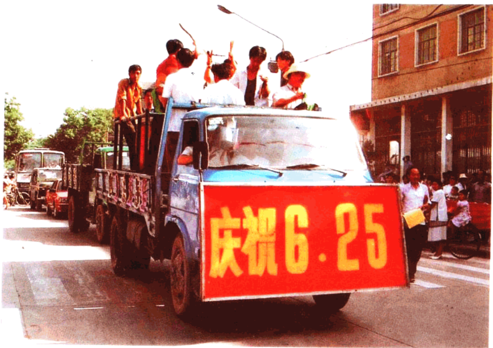
隆重纪念6·25全国“土地日”