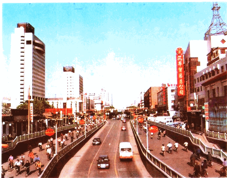
搞好旧城改造，提高土地利用率。图为改造后的市中山路