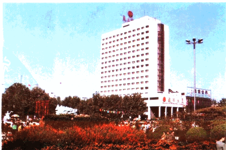
生气盎然的城市街头