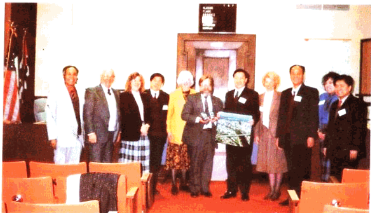
1993年1月， 市委副书记甄树声 (右五)率代表团考 察美国土地管理情 况时与地方官员合 影