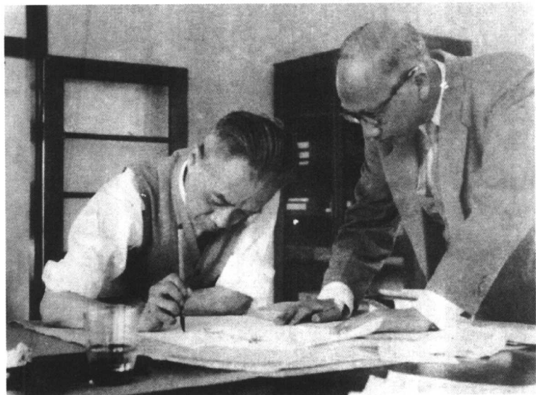
上：胡适任北京大学校长期间，在学生集会上演讲。