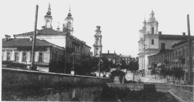
图5 集中在维捷布斯克城中心的富丽壮观的历史建筑物，这是典型的19世纪俄罗斯城镇布局

维捷布斯克的城市规划是典型的19世纪俄罗斯城镇布局，城市的中心集中了大量富丽壮观的历史建筑物（图5），其中包括乌斯宾大教堂、诸多宫殿和巴洛克风格的教堂。随着18世纪60年代众多经由维捷布斯克的铁路开通，以及桥梁、车站和旅馆的增设，维捷布斯克很快便扩展成具有相当规模的大城市，并以其高度的工业化而开始闻名于世。到19世纪下半叶，维捷布斯克（图6）已经成为重要的铁路枢纽，从敖得萨、基辅到圣彼得堡，从里加向西到莫斯科都途经此地，有效地密