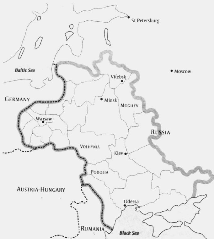
图4 19世纪末俄国地图，夏加尔将在这片广袤的土地上执著地追寻他的理想，同时又不得不最终远离这片让他爱恨交加，热情与绝望同在的地方

居住在外省，而居民则多为没有文化的贫穷农民。据统计，1897年的俄罗斯犹太人占总人口的93.6%，这些人虽不富裕，却都虔诚地遵守法律，接受良好教育。他们与异教徒友好往来，互通有无，贸易往来频繁。早在16世纪（或许更早）犹太商人就已经抵达维捷布斯克，截至1897年，夏加尔10岁时，犹太人已经占该城总人口的一半以上。导致这里犹太人人口剧