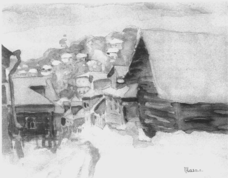
图2 夏加尔心目中充满温馨气息的故乡维捷布斯克，1906年，纸本，水彩画