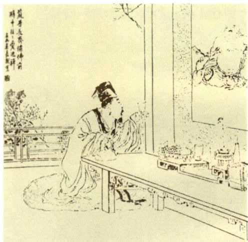
▶ 清代 吳友如《禪室品茶》

入寮堂者白寮主掛點茶牌牌左小紙貼云 某拜請 寮主退齋罷備香燭普同問訊揖寮主居士位點茶 人居賓位略坐起身燒香問訊復坐點茶收盞寮主 起爐前相謝 自寮堂出充頭首者點交代茶畢別 日令茶頭報寮主掛點茶牌齋退鳴寮中小板點茶 人門外右立揖衆入爐前問訊寮主主位點茶人分 手位略坐起身燒香問訊復坐獻茶了寮主與衆起 身爐前致謝送點茶人出 自寮寮出充頭首者令 茶頭預報寮主掛點茶牌齋退鳴板先到衆寮門外 右立揖衆入位立定問訊揖坐進中間上下間燒香 復中間上下間問訊仍中央問訊寮元掛點茶人對 面位坐行茶畢寮元出爐前致謝送出 入衆寮者 點茶 寮茶同 但寮元寮長分賓主位自不可入位坐 頭首就僧堂點茶