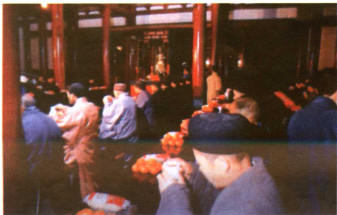
▲ 佛教普茶儀式 选自《中国茶文化》