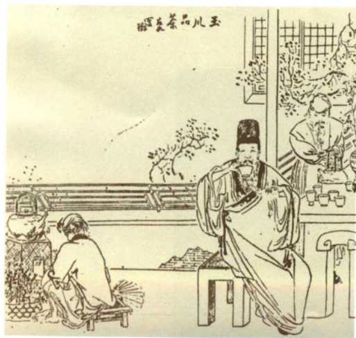
▼ 清代 吴友如《玉川品茶》