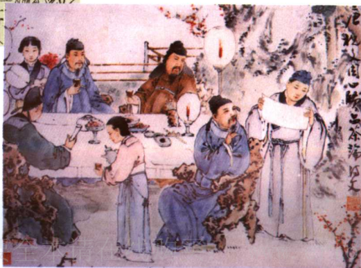
◀清代 点石斋《文士品茶图》