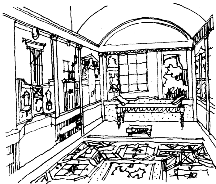
图 1-1 罗马人别墅卧室

古罗马共和制时代,文化艺术总体风格是朴素、严谨的。罗马帝国建立后,由于物质的丰富和采用奴隶来劳动,贵族们便开始了豪华的生活。他们热心于住宅建设,典型的布局是列柱式的中庭,有前后两院,前庭中央有带大窗的接待室,后庭为家属用的诸房间。豪华的贵族宅邸室内装修很考究,有大理石墙面,华丽的壁画,还有灯具和暖炉等。古罗马家具有座椅、躺椅、桌、柜等,形式与古希腊家具相仿,不少也用金属、大理石等加以装饰。图 1-1 为意大利庞贝城遗址发掘的古罗马别墅卧室的复原图。