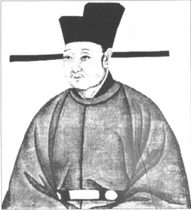
宋徽宗 (1082—1135) 即赵佶。神宗之子, 哲宗之弟。1100—1125年在位。有书法、绘画等天才, 却乏治国平天下之才能。其退位之时即是陆游出生之日。