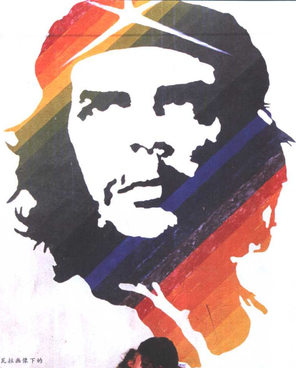
切·格瓦拉画像下的一对情侣