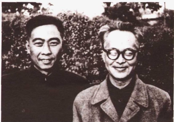
与沈从文先生 1962年春