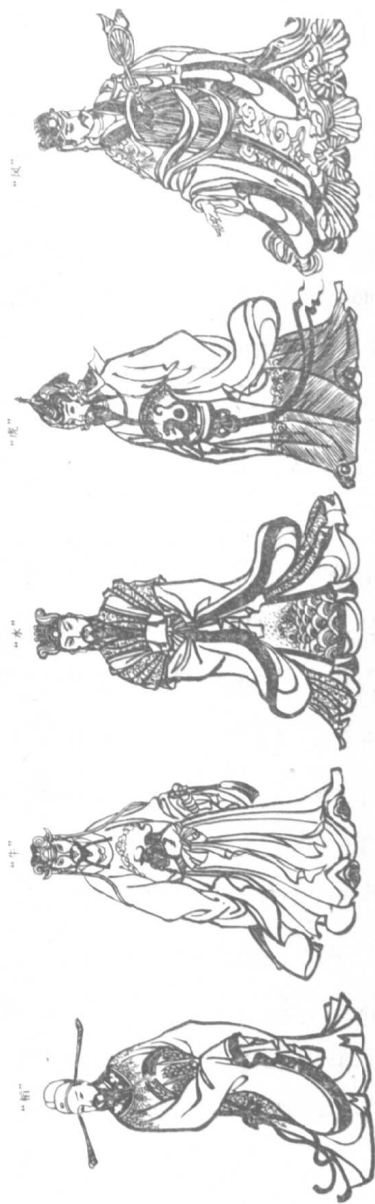
图 3 不同等级的大臣的服装