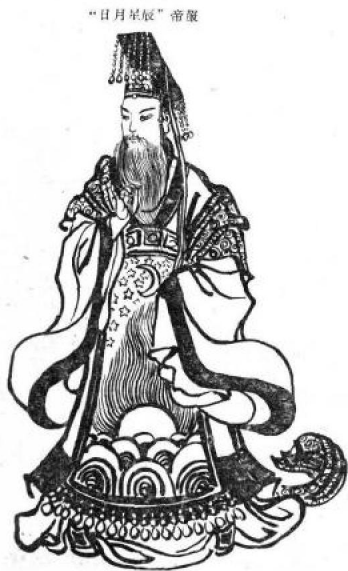
图2 古代帝王的帝服

制”和“服式”的史料记载：中国是世界上第一个出现服制的国家。大约在公元前二十一世纪，随着奴隶制时代的开始，服装也出现了森严的等级制度。当时的王公贵族们为显示自己与普通百姓的差别，曾按不同的社会等级，制定了“服制十二章”。例如，帝王戴的帽子为“冕”，臣、相戴的帽子为“冠”；天下只有帝王一人穿黄色的衣服，普通百姓只能穿青色的。