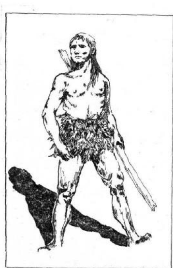
图1 原始社会的“衣服”

祖先从赤身裸体地生活到开始穿上树叶、兽皮类的简单服装，至今却仅仅只有六千年的历史。值得骄傲的是，我们中华民族是世界上最早穿上衣服的民族之一。