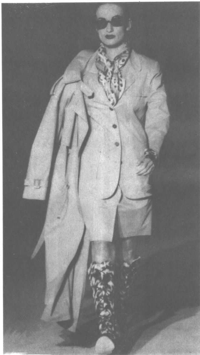
服装内外衣，上下装面料色彩完全一致，取得统一感，围巾、鞋纹样变化起活跃作用。