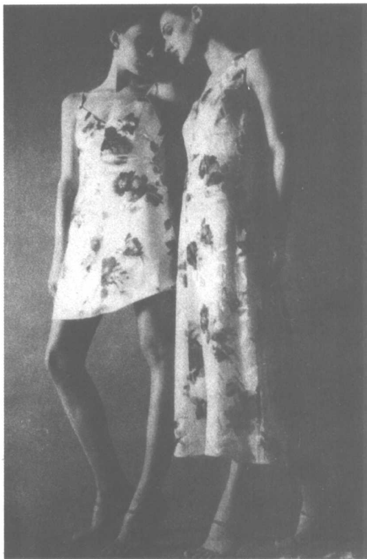
长短的变化形成不同服装个性