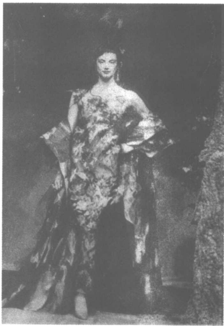
面料构成立体的艺术形象

服装设计同其他艺术一样，点、线、面、体和形态是构成形式美的基础要素；变化统一、对比调和、均衡、节奏是构成形式美的原理与法则。因此研究形式美的原理与要素是为了循其规律，提高审美能力(图1)。