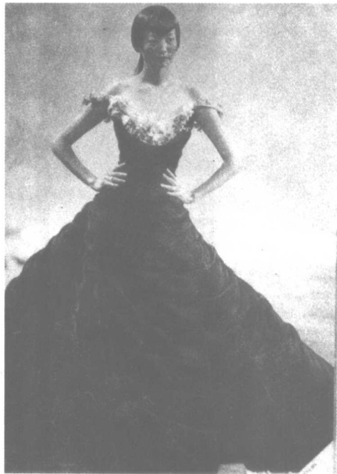
上身围度与裙摆围度,上下装长度比例形成明显变化。