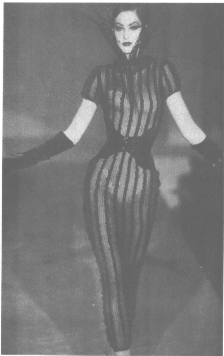
同形同量的对称形式