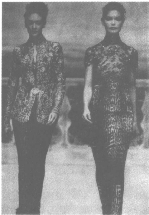
复杂的纹样，不同面料的搭配，产生丰富的变化，以黑灰色调进行统调。

变化和统一是相对的，二者相互依存，不可偏废。适当的变化，显得热烈、丰富，但是过多的变化也会显得无秩序和纷乱无章。初学服装设计最易犯的错误是“杂乱无章”，往往使用过多的图案、花边、分割线以及各种颜色，结果既繁琐又俗气。统一会显得严肃和富于理性，但过分的统一会缺乏生气，