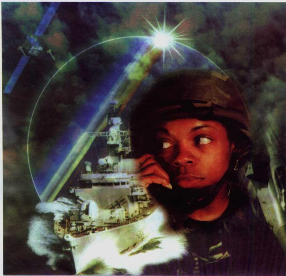
信息边疆无形无界

时代总是在超越历史中发展，人类的边疆观也是这样。如领海的出现，是在人类的生产生活大量进入海洋时才被纳入国家主权范畴的；领空的出现，是在飞机诞生后才刷新国家边疆概念的；随着人类向太空迈进，外层空间“天疆”也隐约出现。进入信息时代后，信息技术的飞速发展已经使边疆观开始向更大、更广阔的概念延伸，传统战场在演变为陆、海、空、天、电多维战