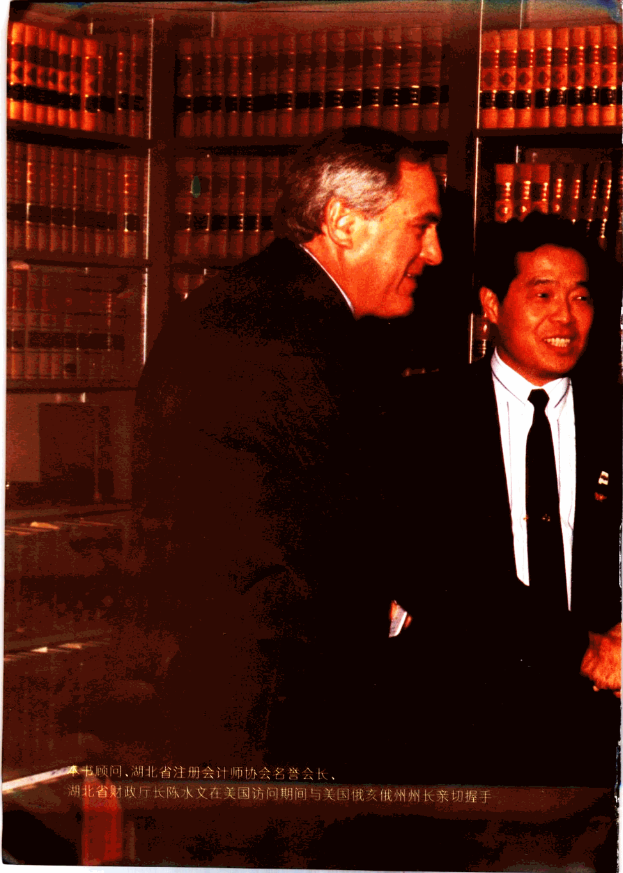
本书顾问、湖北省注册会计师协会名誉会长、 湖北省财政厅厅长陈水文在美国访问期间与美国俄亥俄州州长亲切握手