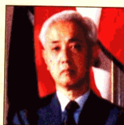
国际会计学会本届 副会长,梁谷恭次郎