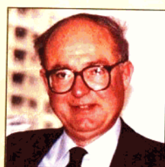
美国会计学会会长 加里·森德姆