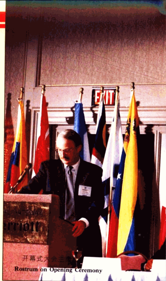
开幕式大会主席 Rostrum on Opening Ceremony