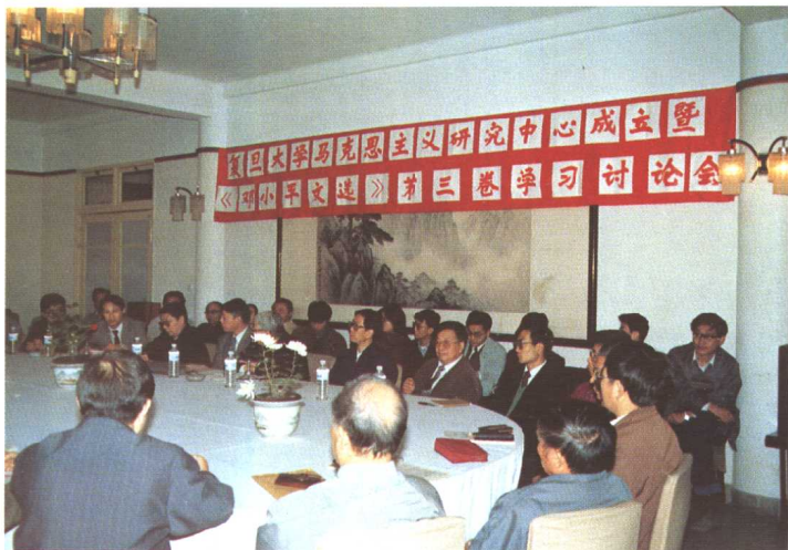
1993年11月12日，我校马克思主义研究中心成立，并举行了《邓小平文选》第三卷学习讨论会。