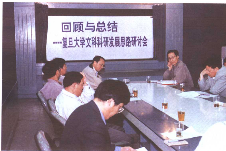
1998年5月25日，我校召开文科科研发展思路研讨会。