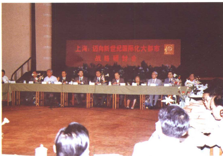
1993年6月14日，复旦发展研究院召开《上海：迈向新世纪国际化大都市》战略研讨会，上海市领导黄菊、汪道涵、金炳华等出席。