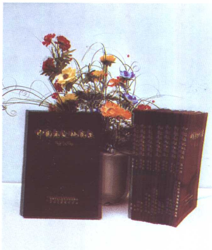
《中国历史地图集》获首届（1979—1985）上海市哲学社会科学优秀成果特等奖，全国高等学校首届人文社会科学研究优秀成果一等奖。