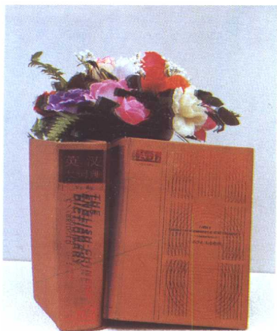
《英汉大词典》获第二届（1986—1993）上海市哲学社会科学优秀成果特等奖，全国高等学校首届人文社会科学研究优秀成果一等奖。