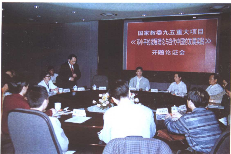
1998年4月22日，教育部“九五”社科重大项目《邓小平的发展理论与当代中国的发展实践》开题论证会在我校举行。