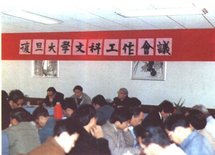
1991年11月13日，我校召开文科工作会议。