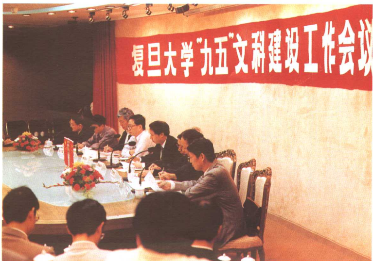
1995年10月21日，我校召开“九五”文科建设工作会议。